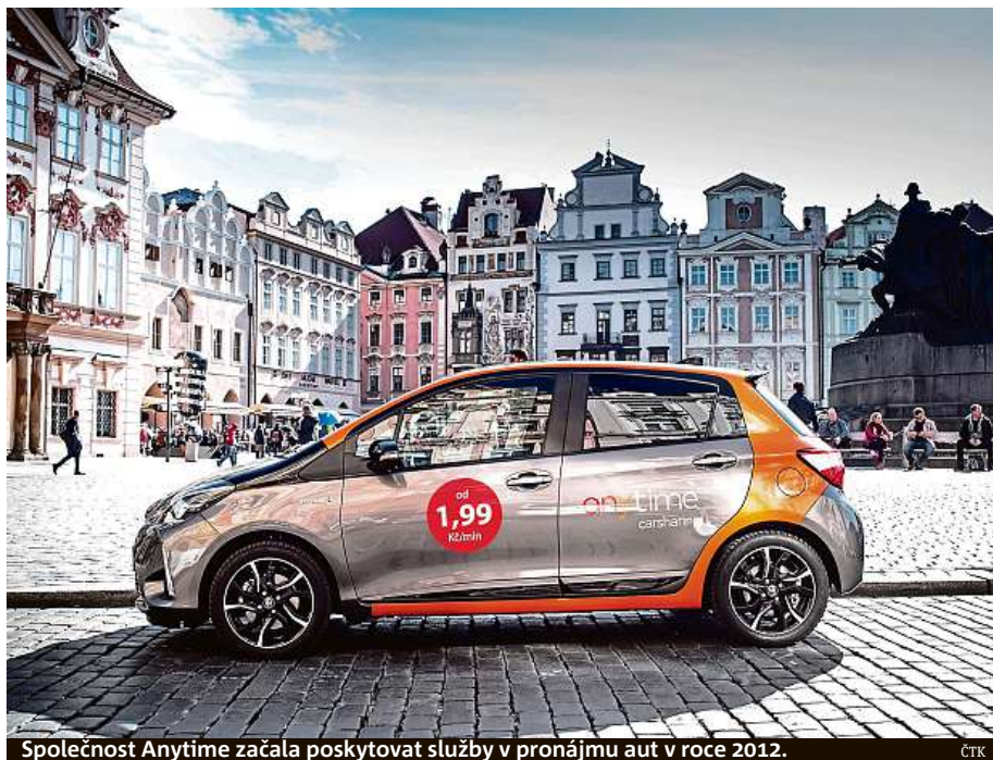
Společnost Anytime začala poskytovat služby v pronájmu aut v roce 2012.

Italská služba sdílení aut Anytime začne působit v Praze. Ode včerejška umožňuje registraci uživatelů prostřednictvím mobilní aplikace a do měsíce začne nabízet sdílení vozidel. Anytime je jedním z největších poskytovatelů carsharingu na světě (provazuje více než 8000 automobilů ve 14 městech ve čtyřech zemích) a prvním nadnárodním hráčem, který přichází do Česka. Tady plánuje v příštích letech investovat až 30 milionů eur, tedy přes tři čtvrtě miliardy korun. Anytime umožňuje vyhledávat, rezervovat a odemknout auta z mobilní aplikace. Pronájem vozidel lze počítat na minuty, hodiny či dny. Rezervace, zvýšení vozidla a vrácení auta je samoobslužné. V nabídce bude několik set vozidel Toyota Yaris Hybrid s automatickou převodovkou a parkovací kamerou. Část vozů má ve výbavě bluetooth. ČTK