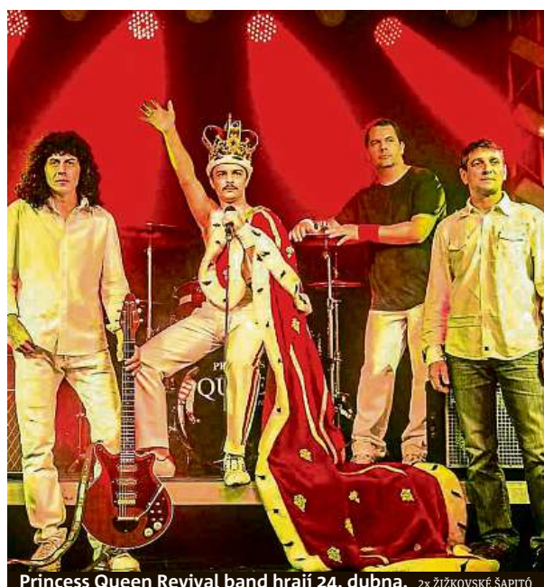
Princess Queen Revival band hraje 24. dubna. 2x ŽIŽKOVSKÉ ŠAPITÓ

a smysluplnou práci v pečovatelské práci v chráněných dílnách. Jelikož Lobaris chce lidem nabídnout, ani na chvíli nepochyboval a rád nabídl spolupráci. V rámci předsta-