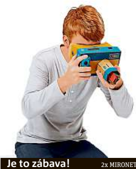
Je to zábava!

ronetu pořídit startovní balíček za 894 korun, jehož součástí jsou brýle pro virtuální realitu a blaster. Ke startovnímu balíčku potom můžete dokoupit jedno ze dvou uvedených rozšíření za 593 korun.