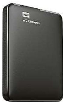
Lehký i odolný MIRONET

V současnosti nejrozšířenější formáty disku jsou 2,5" a 3,5". Z hlediska spolehlivosti jsou tyto formáty v dnešní době již zcela srovnatelné, na