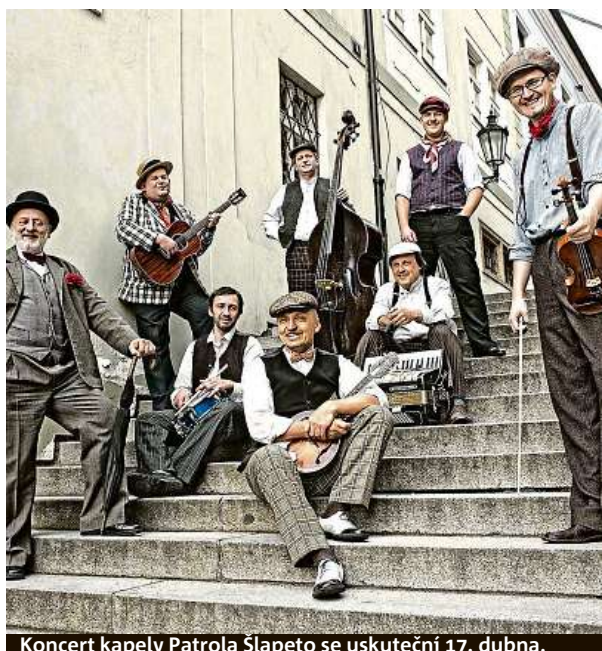
Koncert kapely Patrola Šlapeto se uskuteční 17. dubna.

Agentuře Lobaris, která festival pořádá, přišlo zajímavé dát prostor pro uvedení představení v cirkusovém stanu, právě proto, že se jedná o prostředí, ve kterém s divadelními pokusy před mnoha lety začínali. Snaží se také tímto vytvořit místo, kde se lidé sejdou, posedí a podebatují o tom, co právě měli možnost vidět.