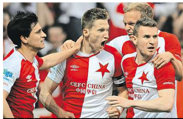
Fotbalisté Slavie se radují z vyrovnávajícího gólu.

„K nepopulárnímu kroku nás vedl především neuspokojivý herní projev týmu a do určité míry i výsledky v jarní fázi nejvyšší soutěže,“ oznámil na klubovém webu gene-