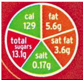
Semafor u Britů

Údaje o cukrech, tučích a soli mají ukázat, jak je jídlo škodlivé pro náš organismus.