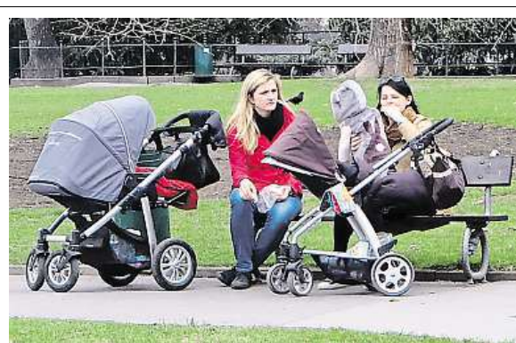
Parky zahájily jarní sezonu, pozor, mají svou večerku