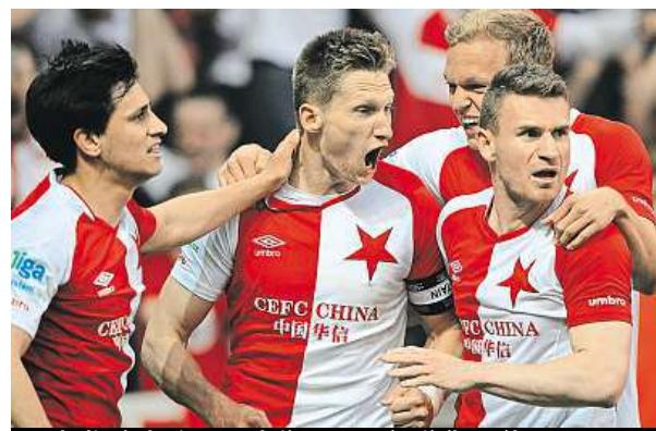
Fotbalisté Slavie se radují z vyrovnávajícího gólu.

„K nepopulárnímu kroku nás vedl především neuspokojivý herní projev týmu a do určité míry i výsledky v jarní fázi nejvyšší soutěže,“ oznámil na klubovém webu gene-