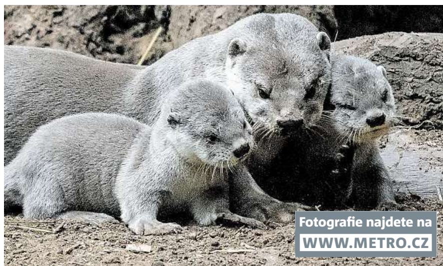
Fotografie najdete na WWW.METRO.CZ