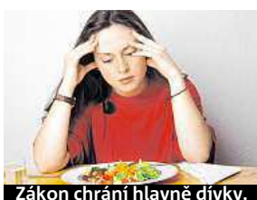
Zákon chrání hlavně dívky.

Podporování anorexie se ve Francii stalo trestným činem.