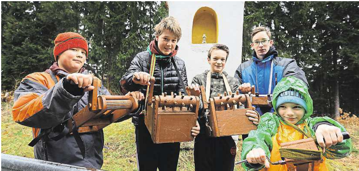
Na Zelený čtvrtek chlapi v Sabíně na Sokolovsku nahrazovali rehtačkami zvony, které uletěly do Říma.

Velikonoce. Policie rozjíždí na silnicích velké kontroly. Alkohol. Zaměř se na řidiče, kteří si během pomlázky dají něco ostřejšího. Počasi. Jezděte opatrně, bude to klouzat nejen na horách STRANA 2