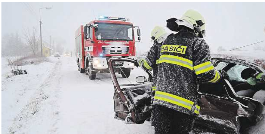
Stejně jako v minulých dnech to na horách bude klouzat.

Velikonoce jsou přesto obdobím, kdy by jen málokdo chtěl vysedávat doma. A to s sebou nese určitá rizika. „Vnímáme především nárůst intenzity dopravy na významných tazích, zvýšený pohyb chodců v turistických oblastech a v neposlední řadě také cestování ke vzdáleným příbuzným často svátečními řidiči,“ vypočítává šéf českých dopraváků Tomáš Lerch. Stranou nezůstává ani popíjení alkoholu, třeba loni policisté načapali přes 180 opilých řidičů. Proto ode dneška až do pondělí musí řidiči počítat s tím, že na policisty na silni-