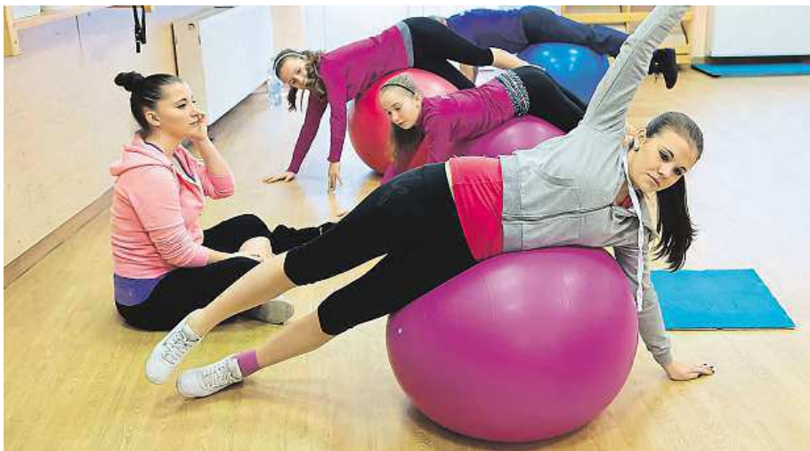
Kurz je zdarma v Kladně. V Železném Brodě a Semilech přispěje VZP částkou 300 Kč.