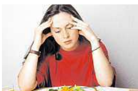
Zákon chrání hlavně dívky.

Podporování anorexie se ve Francii stalo trestným činem.