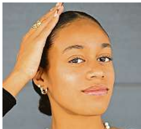
Lu má otce Angolana, matka je Ruska. Narodila se v Česku.

Nicméně v týmu sympatické Lu vládne spokojenost, tím spíš, že před prvním startem sezony přitom jistotou úplně neoplyval. Na domácím Czech Indoor Gala si ale po osmiměsíční pauze hned