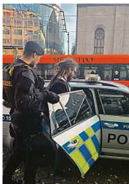
Urza občas veřejně porušuje vybrané zákony.