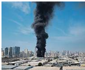
Zásah iránské střely ve městě Šardžá ve SAE AP

V Česku posílíme bezpečnost Česká republika vyšle jeden svůj armádní airbus do egyptského Šarm aš-Šajchu a jeden do jordánského Ammánu. Přivezou domů české občany, případně volné místo nabídnou Česku dalším zemím. Čechy z Ománu zatím bude evakuovat letecká společnost