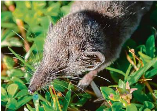
Vědci objevili v etiopských horách nový druh hmyzožravého savce, který váží jen dva až tři gramy. Patří mezi bělozubky. AV ČR

Vědci objevili v etiopských horách nový druh nenápadného hmyzožravého savce, který váží jen dva až tři gramy. Patří mezi bělozubky, což je podčeleď rejskovitých. Pod názvem Crocidura stanleyi nový druh popsal mezinárodní tým vedený vědci z Ústavu biologie obratlovců Akademie věd České republiky (AV ČR).