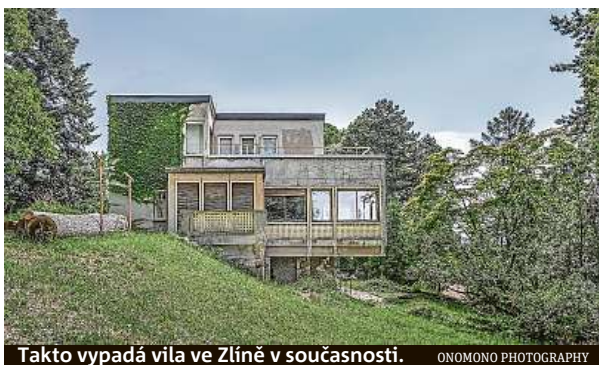
Takto vypadá vila ve Zlíně v současnosti.

„Zřízení Nadačního fondu Zikmundova vila je jedním z prvních velkých splněných úkolů. Velmi si toho vážím a věřím, že vila bude spojuvat a pouat nejen zájemce o cestování, ale i architekturu, umění a kulturu všeobecně.