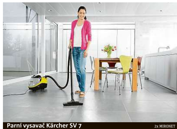
Parní vysavač Kärcher SV 7

Je čas na čistotu, kterou ještě neznáte. Neváhejte a zakupte parní vysavač Kärcher SV 7 v internetovém obchodu Mironet.cz za 12 990 korun.