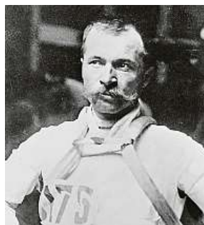
Maurice Garin

Legendární závodník se narodil před 150 lety.