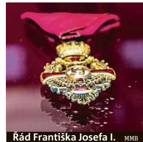
Rád Františka Josefa I.

Doslova oslnující ukázkou vkusu a špičkového šperkařského umění jsou předměty s leskem zlata, stříbra a drahokamů, a to napříč staletími. Výstava představuje i meče. Exempláře z doby bronzové, železné i raného středověku patří k nejnovějším archeologickým objevům, které čerstvě opustily konzervátorské dílny. Speciálně pro výstavu vznikla replika hrobu z mladší doby bronzové, archeology prozkoumaného v jižní části Brna. Autoři výstavy také v nové kresebné rekonstrukci představují souputníka slav-