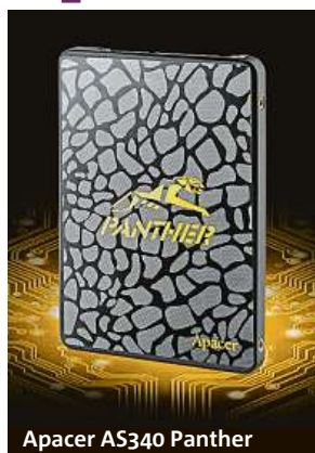
Apacer AS340 Panther

Stává se vám často, že se váš počítač potřebuje „zamyslet“, a to i při nenáročných úkolech? Trvá jeho zapínání věky? Z her si lépe pamatujete načítací obrazovky než příběh?