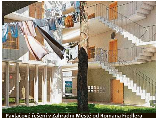
Pavlačové řešení v Zahradní Městě od Romana Fiedlera