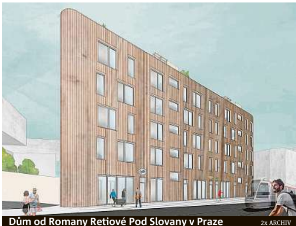
Dům od Romany Retiové Pod Slovany v Praze