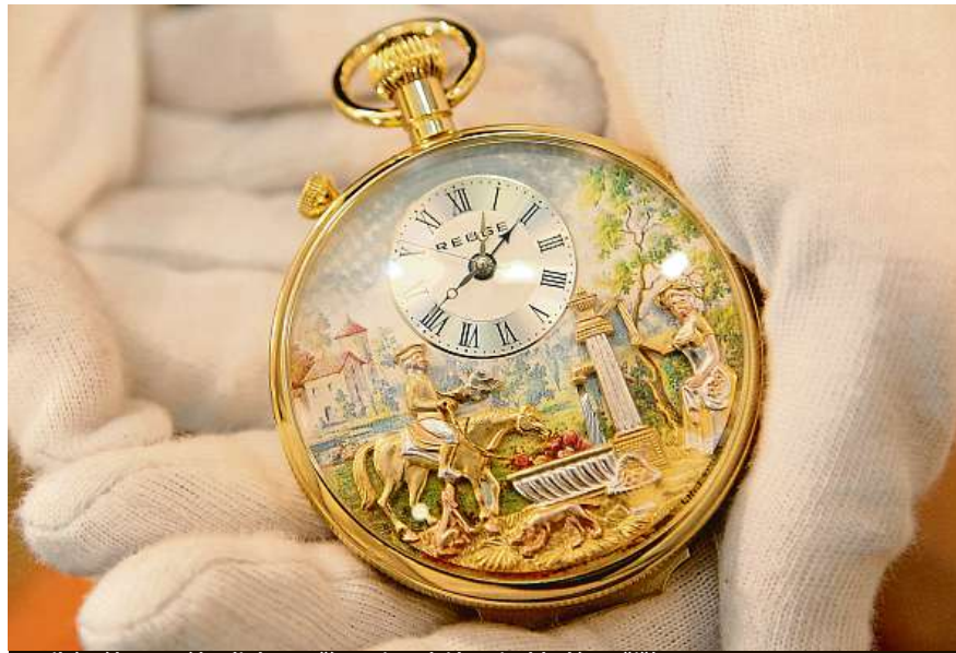
Unikátní kapesní hodinky patří mezi znalci k nejvyhledávanějším.

Nekupoval jsem v začátcích za žádné obrovské sumy. Tři nebo pět tisíc. Niklové hodinky, podobné těm dědečkovým. Po roce jsem jich měl tak dvacet. Narazil jsem na sběratele a tam se to opravdu rozběhlo. Kupoval jsem od něho nějaké hodinky a on mi řekl: „Proč sbíráte tyhle hodinky? Proč neshbíte něco opravdu zajímavého?“ Prý ty hodinky, které mám, prodám zase za ty tři čtyři tisíce. Ale kdybych sbíral kusy, kterých je jen pár nebo jsou jediné, jaké třeba uvidím jen jednou v životě... Protože jsem měl v ten okamžik nějaké