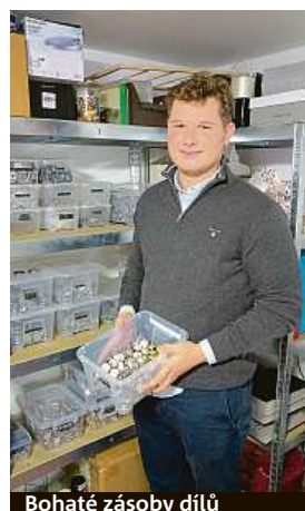
Bohaté zásoby dílů