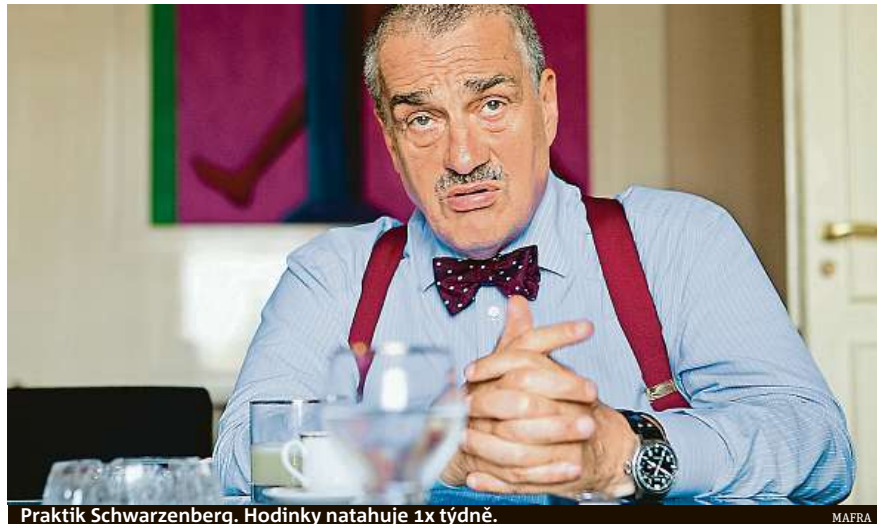
Praktik Schwarzenberg. Hodinky natahuje 1x týdně.

Jeho krédo zní: V době, kdy má u sebe každý mobil, je nošení hodinek zbytečné. Ačkoli hodinky nikdy nenosí, nezřídka se místo hrábnutí do kapsy a pohlédnutí na displej raději táže svých kamarádů a kolegů s hodinkami na ruku. Na někoho pak může pů-