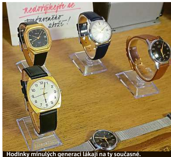
Hodinky minulých generací lákají na ty současné.