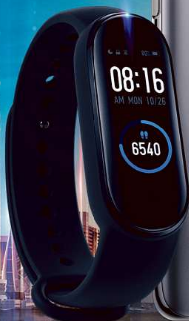
Mi Band 5