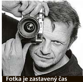
Fotka je zastavený čas

Vojtěch Resler, fotograf věcí, lidí i událostí