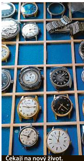
Čekají na nový život.

Klientela se pohybuje hlavně ve věkové hranici 25 až 35 let. „S primkami nevyrostli, ale lidem se líbí, že jsou české, že ta značka má nějaký příběh,“ připomíná hodinářský renovátor zákaznickou nostalgii. Vintage vlna letí i v této branži. U některých se jedná také o omrznuté moderní časomírami. Nestačí jim kontrolovat čas jen na mobilu nebo neustále naslouchat pokynům chytrých digitálních hodiněk.