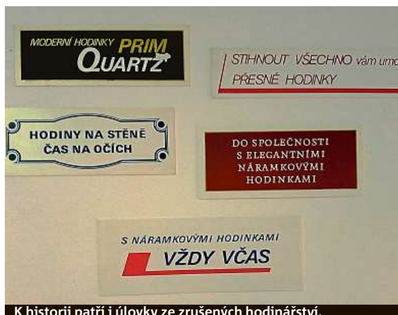
K historii patří i úlovy ze zrušených hodinářství.

Velká poptávka je také po hodinkách, které si nechávaly různé organizace, závody, ale i komunistické stranické orgány doplnit nápisy či logy ke speciálním příležitostem, hlavně ke sjezdům, kdy hodinky dostal každý delegát. „Nedávno jsme měli v prodeji třeba myslivecké primky, občas narazíme i na ty komunistické, ale o ty mají spíše zájem sběratelé než lidé, kteří by je chtěli denně z nostalgie nosit,“ připomíná Reischl.