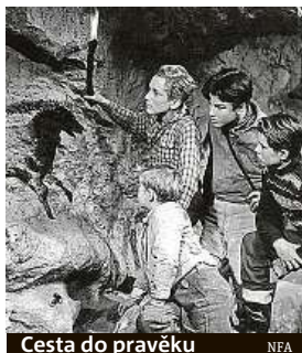
Cesta do pravěku NFA

Adaptace japonské mangy (klasického komiksu) se točí okolo strašpytla Billa Cagea