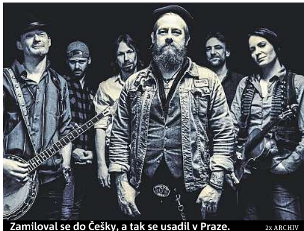
Zamiloval se do Česky, a tak se usadil v Praze.

Občas je česká kultura dost rozdílná. Není to nic negativního. V Irsku mám jiné hospody a taky trochu jiné lidi. Řekl bych, že Češi jsou přímější a taky trochu odměřenější, ale to je spíš takový první dojem. Nic není černobílé.