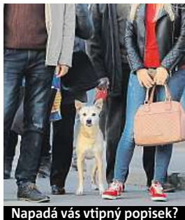
Napadá vás vtipný popisěk?

Napište bublinu a reagujte na sloupek na: www.facebook.com/denikmetro