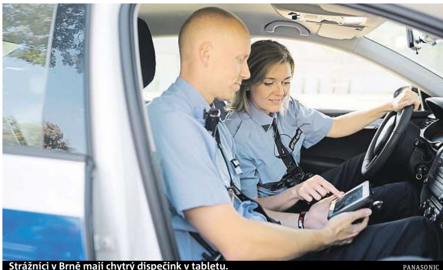
Strážníci v Brně mají chytrý dispečink v tabletu.

Třetí pražská městská část je jedna z průkopnic takzvaného Smart City. Tento koncept se aplikuje po celém světě. „Myšlenka Smart City je novým přístupem k rozvoji měst, a to především díky moderním technologiím, které