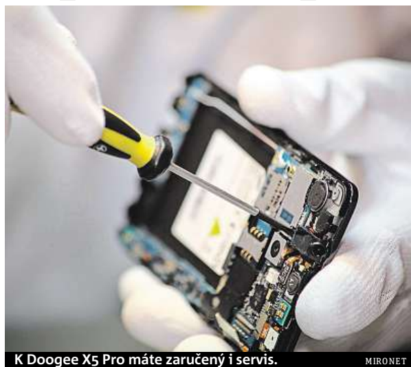
K Doogee X5 Pro máte zaručený i servis.

Kromě přednostního express servisu vám e-shop Mironet garantuje také původ z oficiální české distribuce. Takže váháte-li nad tím, jaký smartphone pořídit, aby splnil i náročnější požadavky a nestál zbytečně mnoho, Doogee X5 Pro z Mironetu by mohl být tou správnou volbou.