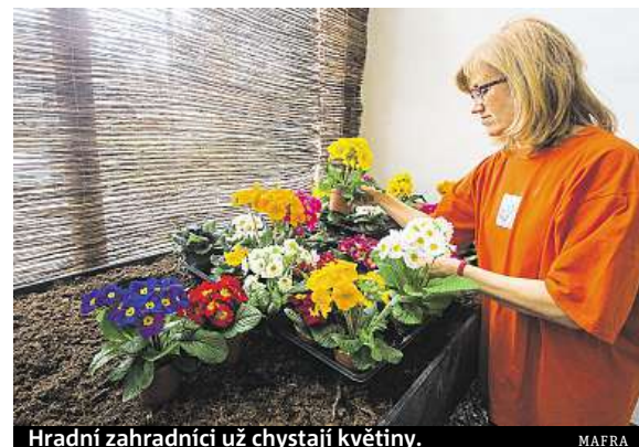
Hradní zahradníci už chystají květiny. MAIRA

Výstava v Empírovém skleníku v Královské zahradě začíná dnes ve 12 hodin, otevřeno je do 12. března. Poslední návštěvníci budou vpuštěni v 17 hodin.