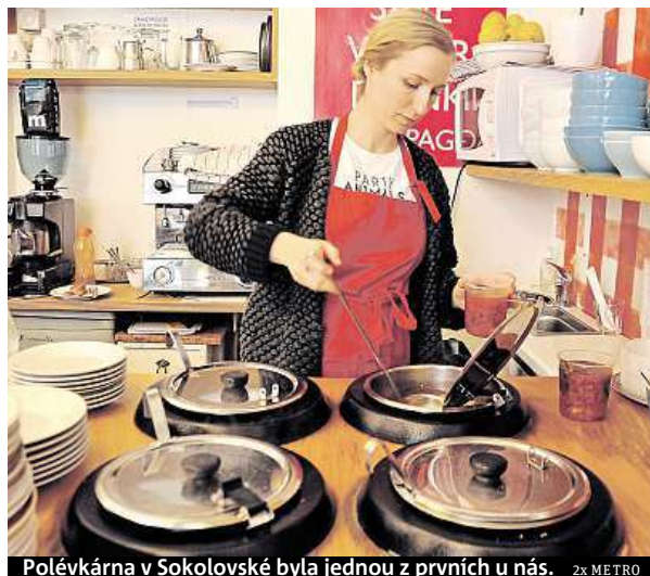
Polévkárna v Sokolovské byla jednou z prvních u nás. 2x METRO

Vaří tu gruzínské kuchařky. Připravují pět polévek denně, navíc mají chačapuri,