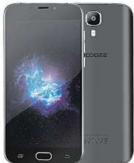
Doogee X9 Mini MIRONET

Pod 5" HD displejem se zakřiveným 2,5D sklem tepe čtyřjádrový procesor MediaTek MT6580 podpořený 1 GB operační pamětí pro vřelý chod moderního operačního systému Android 6.0 a několika naráz spuštěných aplikací. Stejně jako u modelu Doogee X5 máte možnost používat dvě SIM karty současně, čímž odpadají starosti s n