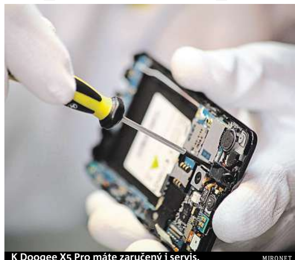
K Doogee X5 Pro máte zaručený i servis.

Kromě přednostního express servisu vám e-shop Mironet garantuje také původ z oficiální české distribuce. Takže váháte-li nad tím, jaký smartphone pořídit, aby splnil i náročnější požadavky a nestál zbytečně mnoho, Doogee X5 Pro z Mironetu by mohl být tou správnou volbou.