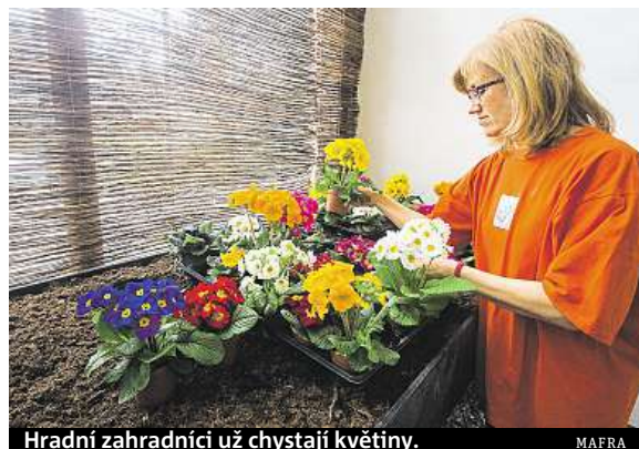
Hradní zahradníci už chystají květiny. MAIRA

Výstava v Empírovém skleníku v Královské zahradě začíná dnes ve 12 hodin, otevřeno je do 12. března. Poslední návštěvníci budou vpuštěni v 17 hodin.