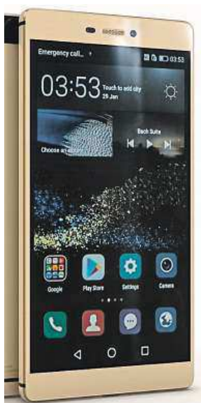
Huawei vyhrál. HEUREKA.CZ

Asi nejzajímavější změny nastaly v kategorii, která patří na internetu mezi nejoblíbenější – mobilní telefony.