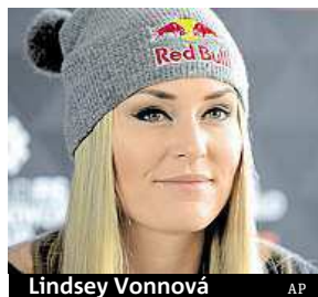
Lindsey Vonnová AP

hraje. Ke svému prvnímu velkému křišťálovému glóbu míří Švýcarka Lara Gutová, která osm závodů před koncem ztrácí na první místo Vonnové pouze 28 bodů. ČTK