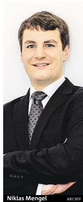
Niklas Mengel ARCHIV