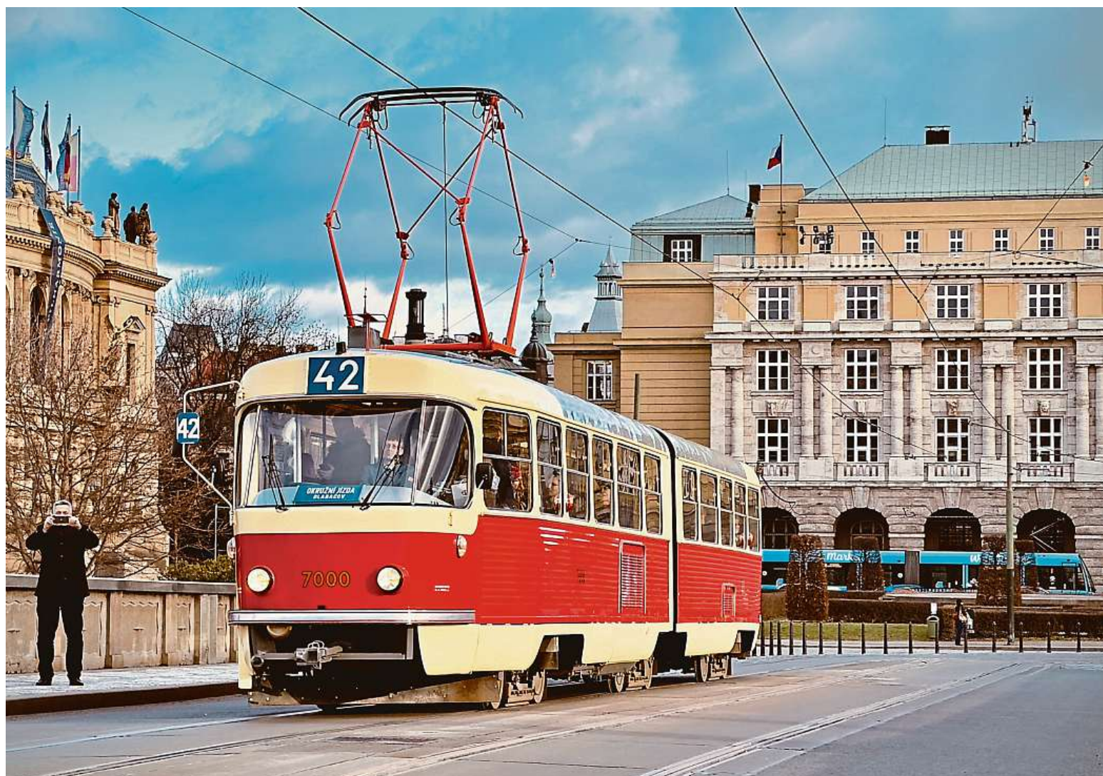
Igelitový závoj raritní Tatry K2 je dole, deník Metro se v ní projel. Unikátní kloubová tramvaj bude vozit turisty Prahou na lince číslo 42. Více strana 2 ROMAN HLOCH

Tuzemské hory. Máte-li dobré úmysly, jste vítáni. Nejen Krakonoš. Nad Jeseníky bdí jeho příbuzný Praděd, Krušným horám vládne Marzebilla. Český ráj. Patronem je skřítek Pelíšek, ochránce Prachovských skal STRANA 14