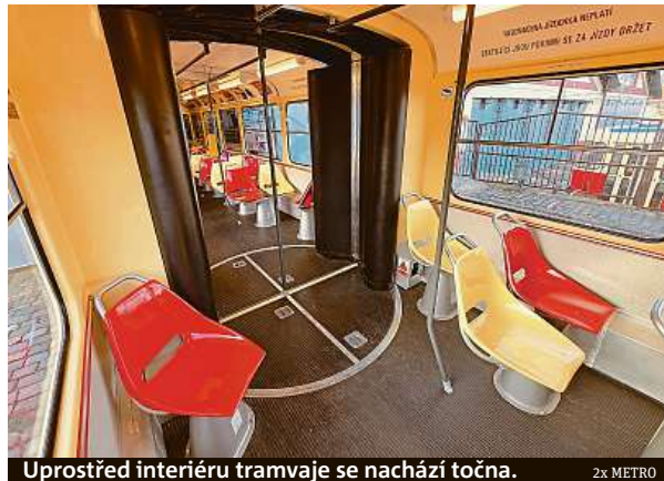
Uprostřed interiéru tramvaje se nachází točna.

DPP nejprve tajil detaily ohledně příjezdu retro tramvaje do hlavního města, aby následně kloubovou tramvaj krátce po Novém roce vyslal