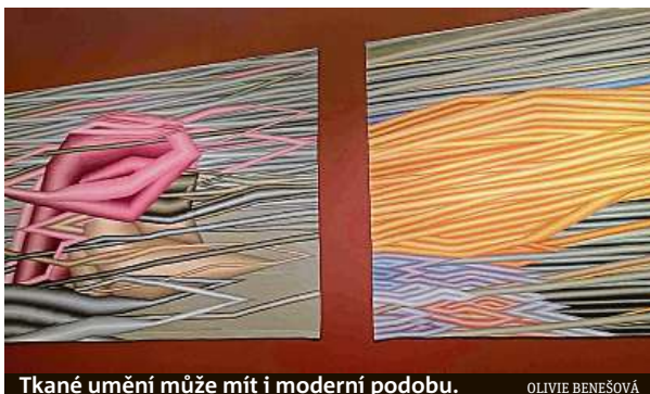
Tkané umění může mít i moderní podobu.

Hlavní myšlenkou výstavy je návrat k řemeslnému umění, jehož tradice se pomalu vytrácí a byla by škoda ji ztra-