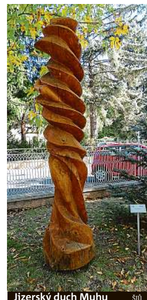
Jizerský duch Muhu