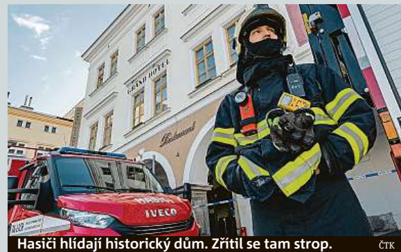
Hasiči hlídají historický dům. Zřítel se tam strop.