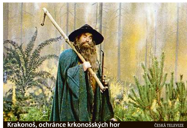
Krkonoš, ochránce krkonošských hor

Patronkou Krušných hor je Marzebilla, která se podle pověstí nejvíce zdržuje v okolí