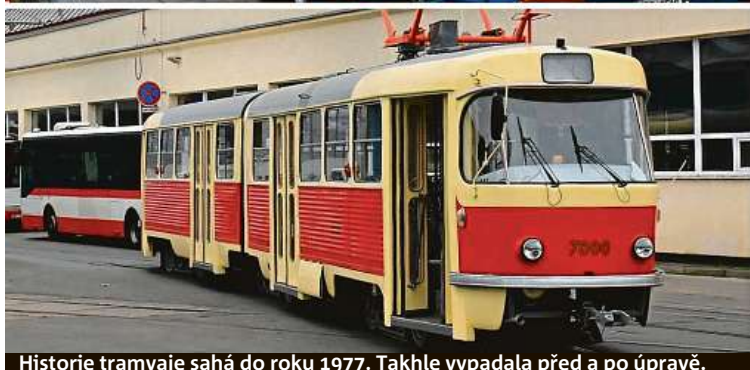
Historie tramvaje sahá do roku 1977. Takhle vypadala před a po úpravě.