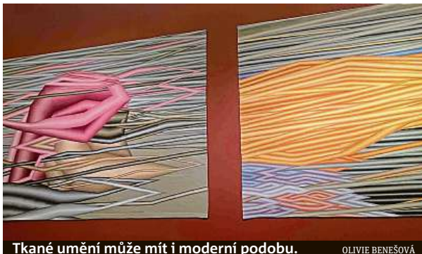
Tkané umění může mít i moderní podobu.

Hlavní myšlenkou výstavy je návrat k řemeslnému umění, jehož tradice se pomalu vytrácí a byla by škoda ji ztra-