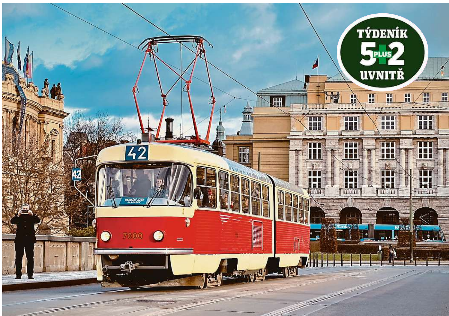
Igelitový závoj raritní Tatro K2 je dole, deník Metro se v ní projel. Unikátní kloubová tramvaj bude vozit turisty Prahou na lince číslo 42. Více strana 2 ROMAN HLOCH

Tuzemské hory. Máte-li dobré úmysly, jste vítáni. Nejen Krakonoš. Nad Jeseníky bdí jeho příbuzný Praděd, Krušným horám vládne Marzebilla. Český ráj. Patronem je skřítek Pelíšek, ochránce Prachovských skal STRANA 14