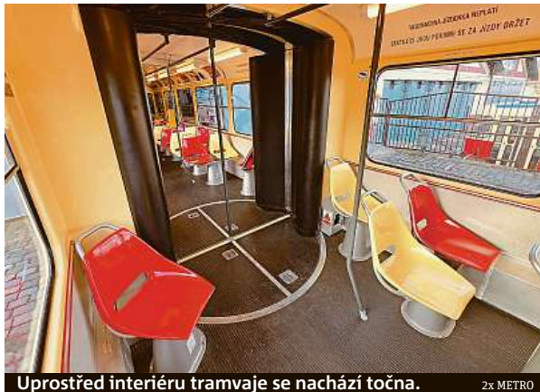
Uprostřed interiéru tramvaje se nachází točna.

DPP nejprve tajil detaily ohledně příjezdu retro tramvaje do hlavního města, aby následně kloubovou tramvaj krátce po Novém roce vyslal