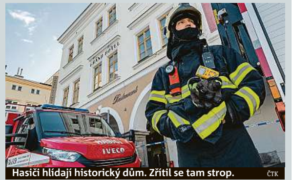
Hasiči hlídají historický dům. Zřítel se tam strop. ČTK