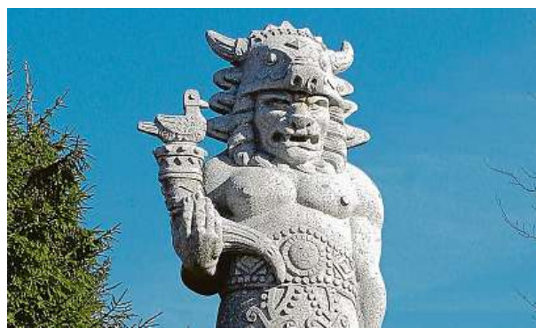
Bůh Radegast bdí nad Beskydami.