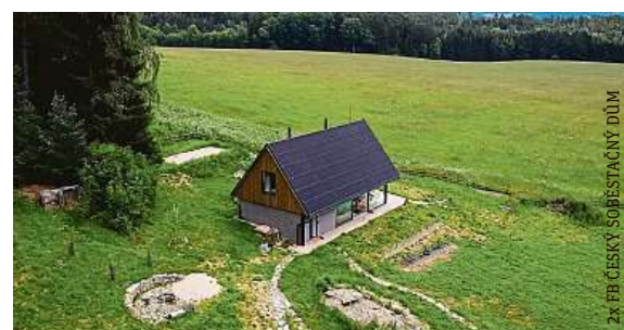
2x FB ČESKÝ SOBĚSTAČNÝ DŮM