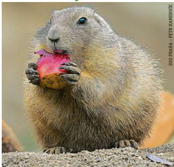
ZOO PRAHA – PETR HAMERNÍK

Psouni préríovní nikdy nevycházejí ze střeží. Ačkoli se může zdát, že krmícho se jedince zajímá jediné ovoce, na kterém hoduje, opak je pravdou. Ostražití hlodavci mají důmyslný bezpečnostní systém. Několik psounů vždy hlídá okolí, aby mohli v případě nebezpečí varovat zbytek skupiny hlasitým štěkotem.