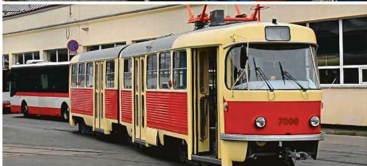
Historie tramvaje sahá do roku 1977. Takhle vypadala před a po úpravě.