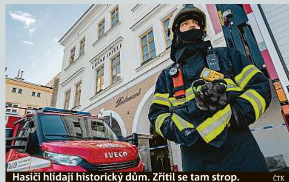
Hasiči hlídají historický dům. Zřítel se tam strop.