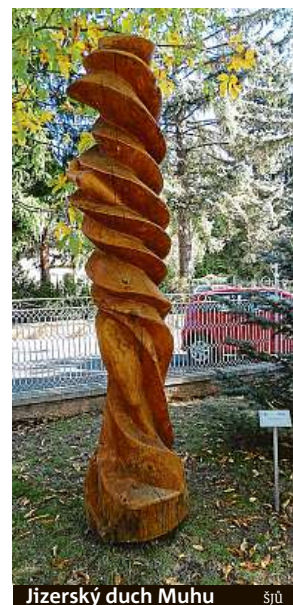
Jizerský duch Muhu