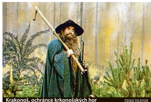
Krakonoš, ochránce krkonošských hor

Patronkou Krušných hor je Marzebilla, která se podle pověstí nejvíce zdržuje v okolí