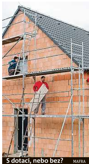
5 dotací, nebo bez? MAFRA

Zatímco v počátcích podpory vyspělého a šetrného byd-