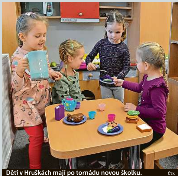
Děti v Hruškách mají po tornádu novou školku. ČTK