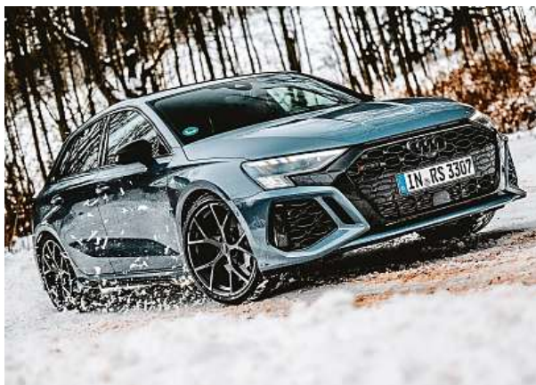
RS3 je o 25 milimetrů blíže k zemi než klasická Audi A3.

Staria je na začátku výroby dodávána výhradně s motorem 2,2 CRDi o výkonu 130 kW. Zatímco u výbavových stupňů Smart a Style lze vybírat mezi šestistupňovou manuální a osmistupňovou automatickou převodovkou, je u základní výbavy Comfort jedinou volbou manuál, u vrcholné varianty Luxury pak automat. Volitelně je vyjma výbavového stupně Comfort k dispozici také pohon všech čtyř kol. Příplatek za automat i čtyřkolku činí 50 tisíc korun. HOP