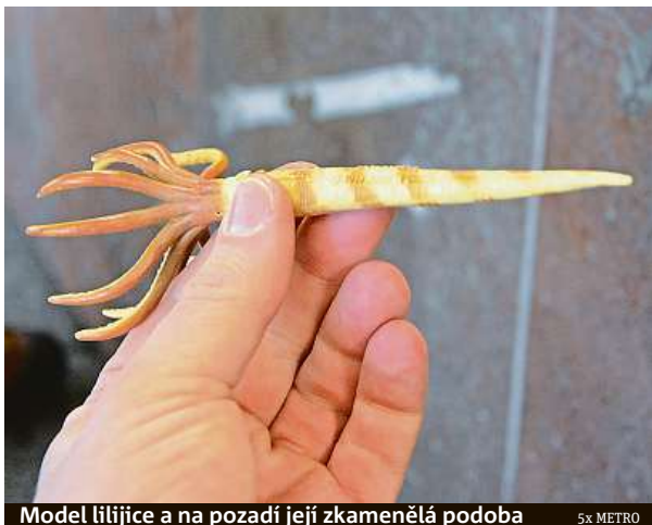
Model lilijice a na pozadí její zkamenělá podoba

„Už na dlažbě pod našima nohama vidíme velké černé fleky. Lidé si někdy myslí, že to jsou třeba kazy nebo zvýkačky, ale není to pravda. Jsou to xenolity. Tedy frag-