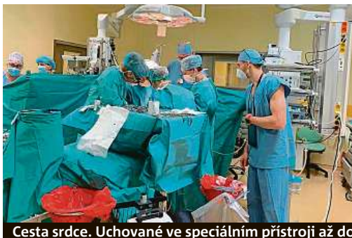
Cesta srdce. Uchované ve speciálním přístroji až do rukou pražských zdravotníků. 5x IKEM