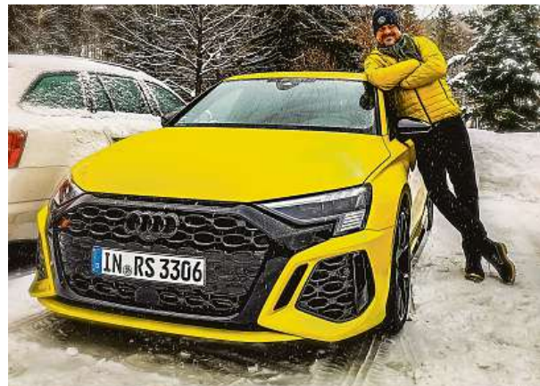
Je líbo žlutého taxíka? A nebude vám v zatáčkách špatně?