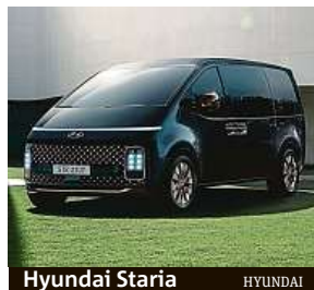
Hyundai Staria HYUNDAI

Velkoprostorové MPV Hyundai Staria míří na český trh, prozatím pouze ve variantě pro přepravu cestujících. Model Staria Tour bude nabízen ve čtyřech výbavových stupních včetně vrcholné verze Luxury. Ceny devítimístné osobní verze začínají na částce 899 990 Kč.