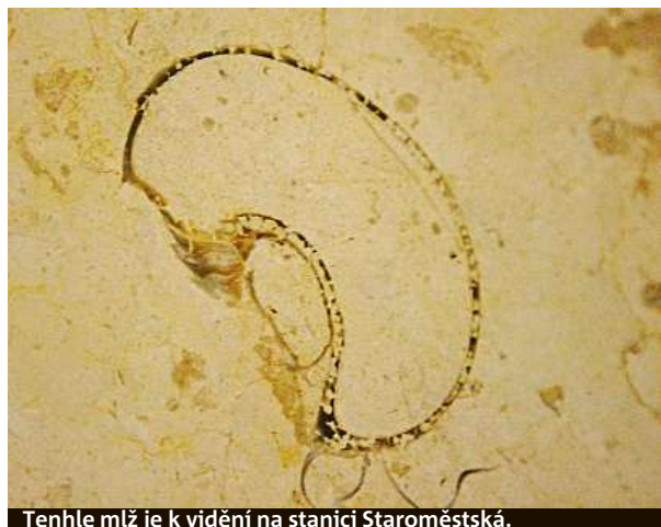
Tenhle mlž je k vidění na stanici Staroměstská.