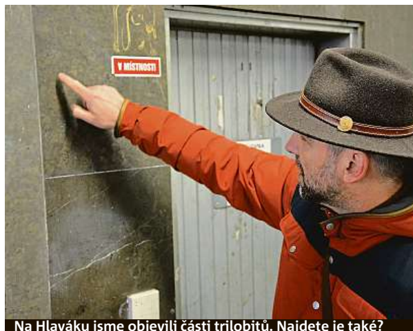
Na Hlaváku jsme objevili části trilobitů. Najdete je také?