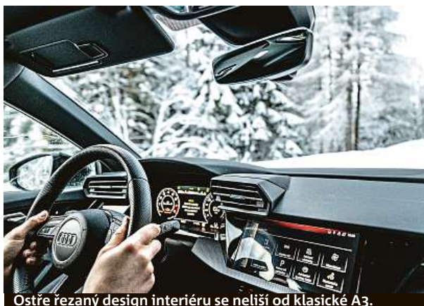
Ostře řezaný design interiéru se neliší od klasické A3.

Systém na zadní nápravě Torque Splitter zvyšuje bezpečnost v provozu, na druhé straně umožňuje dosahovat rychlejších časů na kolo na závodních okruzích. To v červnu 2021 potvrdil i Frank Stippler, závodník a vývojový jezdec společnosti Audi Sport, na Severní smyčce Nürburgringu o délce 20,832 km. Za volantem vozu RS 3 Limuzína stanovil rekord v kompaktním segmentu časem 7:40,748 minuty.