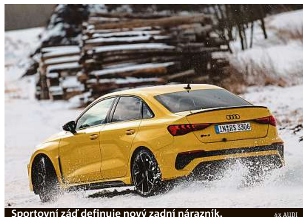
Sportovní záď definuje nový zadní nárazník.