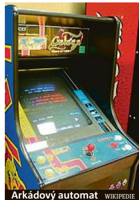
Arkádový automat WIKIPEDIE

Jen málokdo si ale tehdy mohl dovolit koupit si domů vlastní konzoli nebo počítač, a tak se věhlas těchto značek šířil především díky arkádovým automatům, v nichž si hráči za pár drobných kupovali herní čas. V dobách Čes-