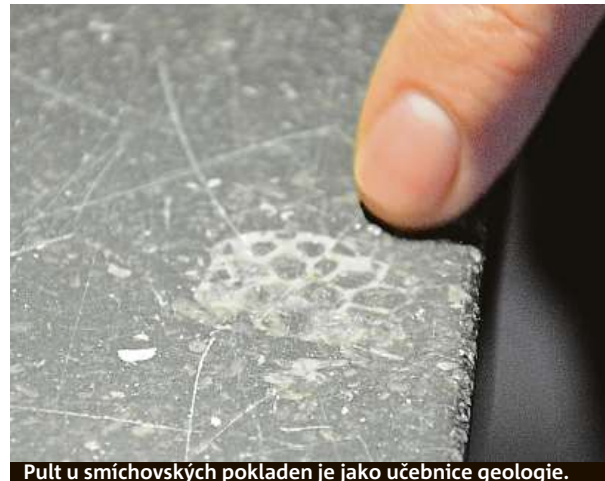
Pult u smíchovských pokladen je jako učebnice geologie.