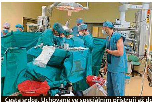
Cesta srdce. Uchované ve speciálním přístroji až do rukou pražských zdravotníků. 5x IKEM