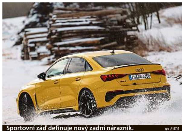
Sportovní zád definuje nový zadní nárazník.