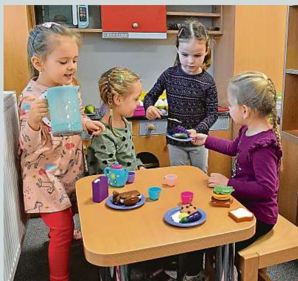
Děti v Hruškách mají po tornádě novou školku.