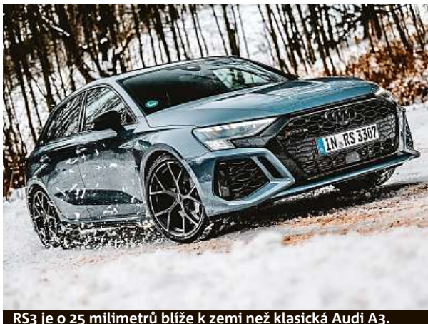
RS3 je o 25 milimetrů blíže k zemi než klasická Audi A3.

Staria je na začátku výroby dodávána výhradně s motorem 2,2 CRDi o výkonu 130 kW. Zatímco v výbavových stupních Smart a Style lze vybírat mezi šestistupňovou manuální a osmistupňovou automatickou převodovkou, je u základní výbavy Comfort jedinou volbou manuál, u vrcholné varianty Luxury pak automat. Volitelně je výjma výbavového stupně Comfort k dispozici také pohon všech čtyř kol. Příplatek za automat i čtyřkolku činí 50 tisíc korun. HOPE