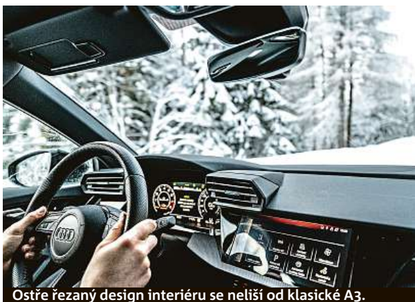
Ostře řezaný design interiéru se neliší od klasické A3.

Systém na zadní nápravě Torque Splitter zvyšuje bezpečnost v provozu, na druhé straně umožňuje dosahovat rychlejších časů na kolo na závodních okruzích. To v červnu 2021 potvrdil i Frank Stippler, závodní a vývojový jezdec společnosti Audi Sport, na Severní smyčce Nürburgringu o délce 20,832 km. Za volantem vozu RS 3 Limuzína stanovil rekord v kompaktním segmentu časem 7:40,748 minuty.