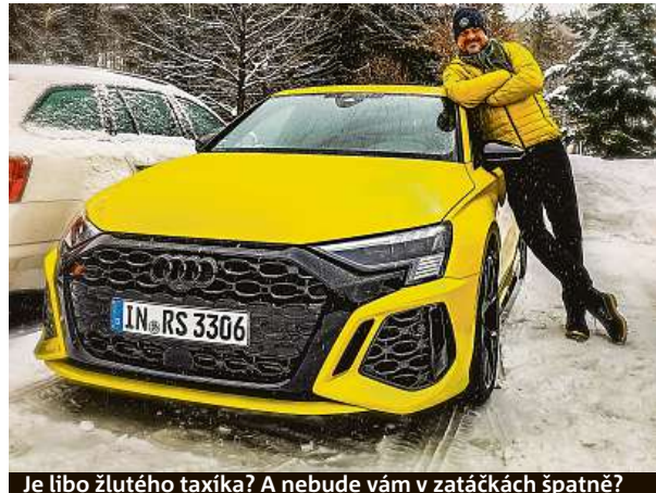
Je líbo žlutého taxíka? A nebude vám v zatáčkách špatně?