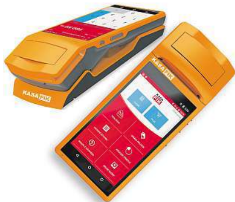
Kasa Fik je dostupná již od 3999 korun. MIRONET

Od března se elektronická evidence tržeb rozšíří. Mějte náskok.