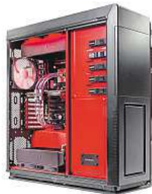
Vytvořte si PC

Mironet na svá PC poskytuje nadstandardní tříletou záruku a dva roky bezplatného čištění, aby váš stroj zůstal v perfektní kondici. Ve všech sestavách PC Mironet se pro-