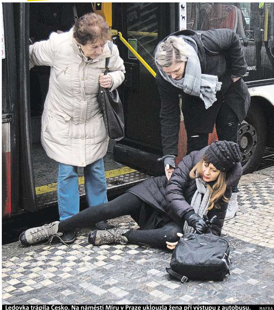
Ledovka trápila Česko. Na náměstí Míru v Praze uklouzla žena při výstupu z autobusu.