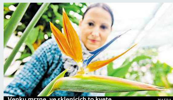
Venku mrzne, ve sklenících to kvete.