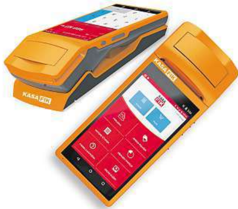
Kasa Fik je dostupná již od 3999 korun.

Jak jsme nedávno upozorňovali, druhá fáze EET se rychle blíží a od prvního března se do elektronické evidence tržeb zapojí podniky v oblasti maloobchodu a velkoobchodu. Pro majitele či manažery prodejen to znamená povinnost opatřit si potřebné vybavení schopné komunikovat se servery Finanční správy. Po zkušenostech z první fáze je doporučováno s nákupem těchto zařízení příliš neotálet a nakoupit