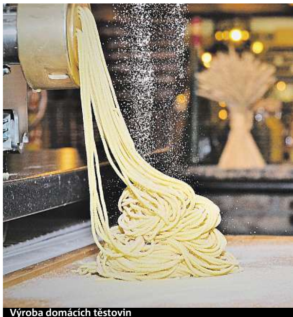
Výroba domácích těstovin