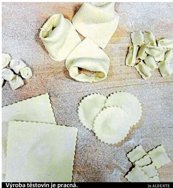
Výroba těstovin je pracná.