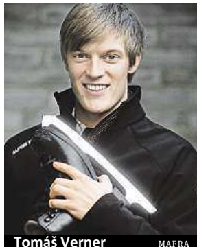
Tomáš Verner

Tomáš Verner je nepochybně nejznámější osobou spojovanou v Česku s krasobruslením v posledních letech. Po konci kariéry jezdí v show, třeba v Rusku se slavným Jevgenijem Pljuščenkem, zároveň pomáhá trénovat mladší následovníky a nově je také tváří následujícího mistrovství Evropy v krasobruslení, které proběhne v lednu 2017 v Ostravě.