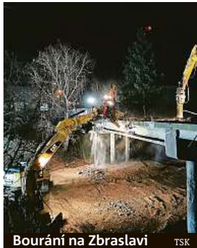
Bourání na Zbraslavi TSK

Dále správu komunikací v letošním roce čeká i stavba nového mostu ve Zbraslavi v ulici K Výtopně a začnou první práce na Barrandovském mostě. Ty ale řidiči nemají zatím vůbec pocítit. „Opravy vrchní stavby, které se již řidičův zásadně dotknou,