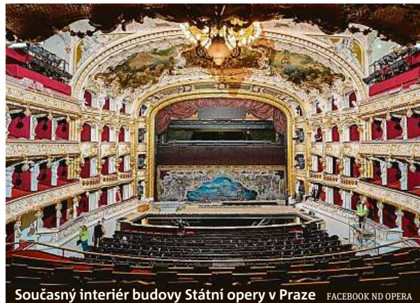
Současný interiér budovy Státní opery v Praze

Státní opera se otevře v neděli 5. ledna, přesně 132 let od svého prvního otevření. Budovu tehdy vystavěl pražský Německý divadelní spolek a otevření obstarali Mistry