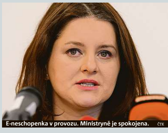
E-neschopenka v provozu. Ministryně je spokojena. ČTK

V nejvyšších partiích Jeseníků leží zhruba 35 centimetrů přemrzlého sněhu. Podmínky jsou již ideální i pro běžecské lyžování, stopu najdou jeho vyznavači upravenou z Ovčárny na Praděd i Švýcárnu, ale i z Červenohorského sedla. Oproti loňsku je však přírodního sněhu na horách stále podstatně méně, rozdíl je až půl metru. V provozu jsou již také téměř všechna lyžařská střediska. „Oproti minulým letům se to výrazně liší, sněhu bylo v tuto chvíli tehdy už o 40 až 50 centimetrů více,“ uvedl dispečer jesenické horské služby Ondřej Škovránek. ČTK a MET