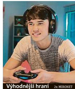
Výhodnější hraní 2x MIRONET

S tímto členstvím získáte z každé hry maximum zábavy. Členství v PlayStation Plus totiž uživatelům odemýká především možnost hrát on-line s živými spoluhráči z celého světa. Ať už se jedná