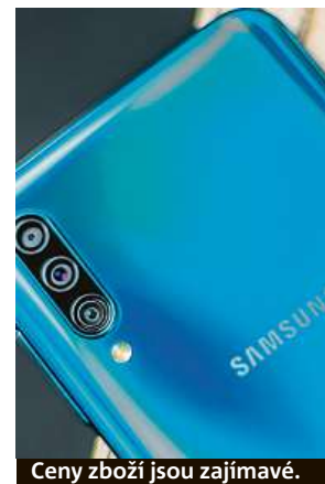
Ceny zboží jsou zajímavé.

Na své si v lednovém výprodeji přijdete také, sháníte-li nový mobilní telefon. Se slevou 18 procent můžete získat například Samsung Galaxy A30s. S pamětí 64 GB, trojitým fotoaparátem a obřím Super AMOLED displejem se jedná o opravdu působivý přístroj. Získejte jej nyní za 5690 korun. Ale pozor, lednový výprodej v Mironetu končí už 15. ledna.