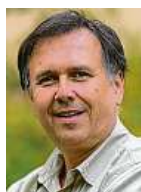
Petr Hamerník Zoo Praha

Návštěvníci Zoo Praha teď mohou v klokaním výběhu pozorovat hned dvě mláďata klokanů rudých naráz – ale chce to trochu štěstí. Mladší