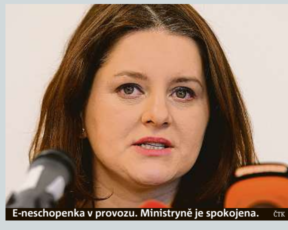
E-neschopenka v provozu. Ministryně je spokojena. ČTK

Česká armáda od začátku roku zařazuje 1000 vojáků do Sil velmi rychlé reakce NATO (VJTF – Very High Readiness Joint Task Force). V případě krize musí být schopni reagovat do pěti dnů. V pohotovosti budou po celý rok. Společně s Poláky, Španěly a Brity tvoří mezinárodní brigádu o velikosti asi 5000 vojáků. ČTK