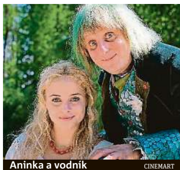
Aninka a vodník CINEMART

Zkušený režisér se po divácky úspěšné pohádce Čertoviny vrátil po dvou letech znovu k tomuto žánru.