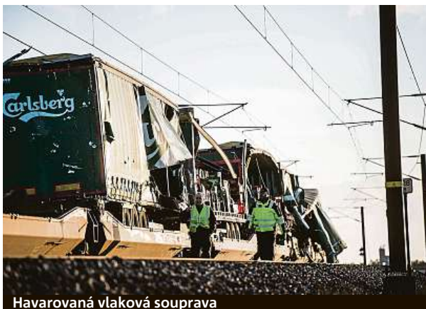
Havarovaná vlaková souprava

Dánská média uvedla, že osobní vlak zasáhla zřejmě