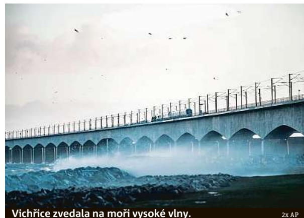
Vichřice zvedala na moři vysoké vlny.

Osmnáctikilometrový most, který vede přes průliv Velký Belt a spojuje ostrovy Sjaelland a Fyn, je určen jak pro železniční, tak pro silniční dopravu. Kvůli silnému vichru byl včera most pro au-