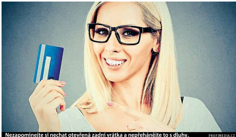
Nezapomínejte si nechat otevřená zadní vrátka a nepřehánějte to s dluhy.

Velmi častou příčinou finančních nesnází je fakt, že lidé nemají přehled o svých výdajích. Příjmy jsou většinou jasné, ale na straně výdajů vyrovnaný rozpočet rozkolísají i například půlroční či roční platby pojištění, platby za kroužky dětí nebo třeba přehnaná touha mít bohaté Vánoce. Přehled o tom, kolik ještě můžete v daném období utratit, lze snadno ztratit. Nejprve si tedy sepište výdaje a příjmy posledního roku a následně podle dostupných