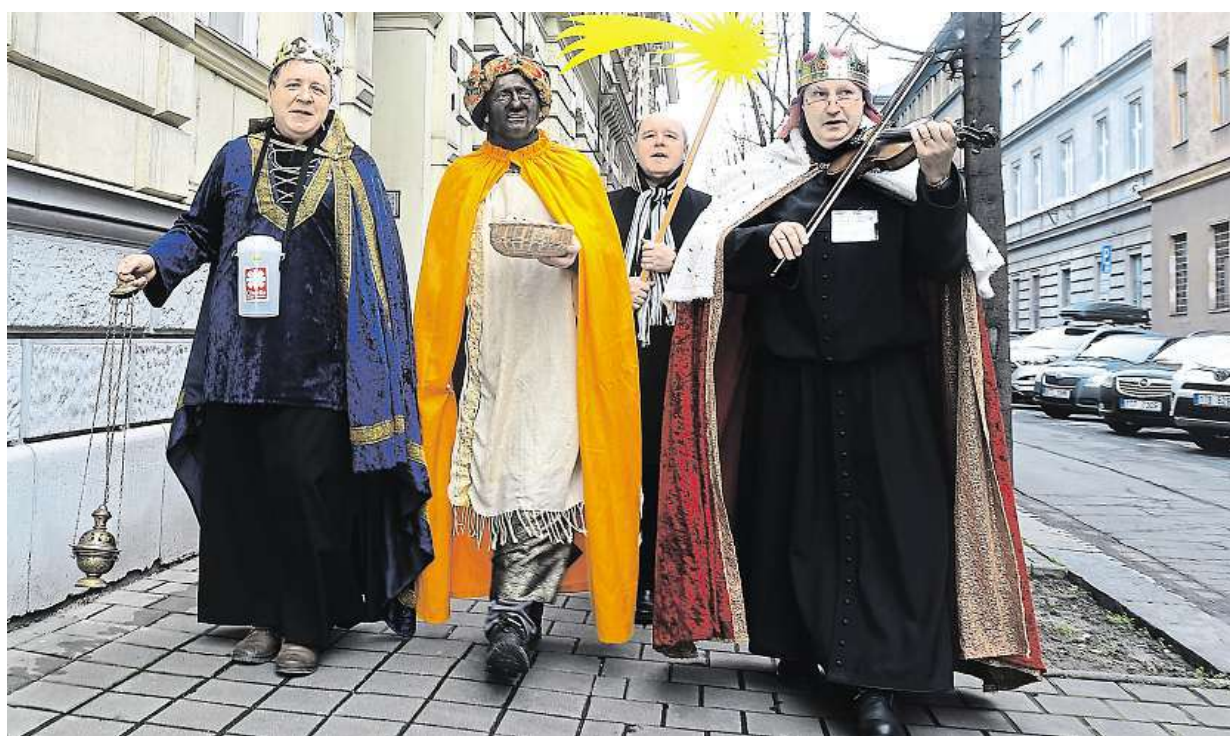
Letošní Tříkrálové sbírky se až do 14. ledna v Moravskoslezském kraji a na Jesenicku účastní tři tisíce skupin koledníků. ČTK

Pomoc odborníků. Zájem o poradny pro odvykání závislosti na cigaretě se začátkem roku rapidně zvyšuje. Biotronická léčba. Jedno až dvouhodinová léčba i za 2200 korun. Odvykání po telefonu. Je zdarma STRANA 4