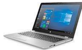
HP 250 G6

Za 12 465 korun, což je cena v internetovém obchodě Mironet, získáte stroj s 15,6" Full HD displejem, který díky matnému povrchu zabraňuje nepříjemným odleskům, a vy se tak vždy budete moci plně soustředit na to, co právě děláte. „Gé šestku“ můžete samozřejmě pořídit v několika rozmanitých konfiguracích. My jsme vybrali variantu s dvoujádrovým procesorem Intel Core i3-6006U, integrovanou