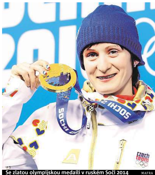
Se zlatou olympijskou medailí v ruském Soči 2014

udělala všechno. Evropa letos není tak důležitá, abych tam startovala a pak se dva tři týdny trápila,“ doplnila třicetiletá reprezentantka, která má problémy se zády od začátku sezony. Také kvůli tomu nekraluje závodům Světového poháru na dlouhých tratích, jak byla zvyklá v minulých letech. Bez větších problémů se však na svých hlavních tratích 3000 a 5000 metrů kvalifikovala na olympiádu. ČTK