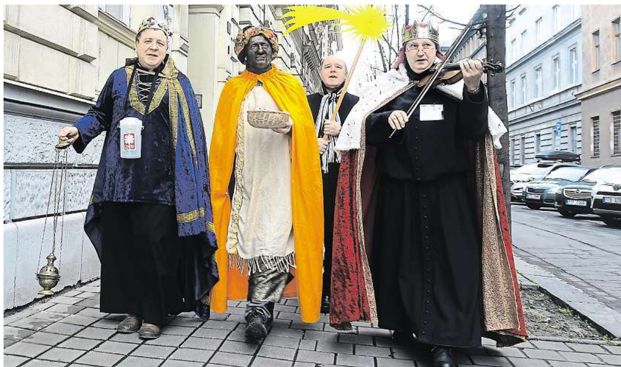
Letošní Tříkrálové sbírky se až do 14. ledna v Moravskoslezském kraji a na Jesenicku účastní tři tisíce skupin koledníků.

Pomoc odborníků. Zájem o poradny pro odvykání závislosti na cigaretě se začátkem roku rapidně zvyšuje. Biotronická léčba. Jedno až dvouhodinová léčba i za 2200 korun. Odvykání po telefonu. Je zdarma STRANA 2