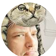
Jakub Stupka Ne, protože je to alibismus.