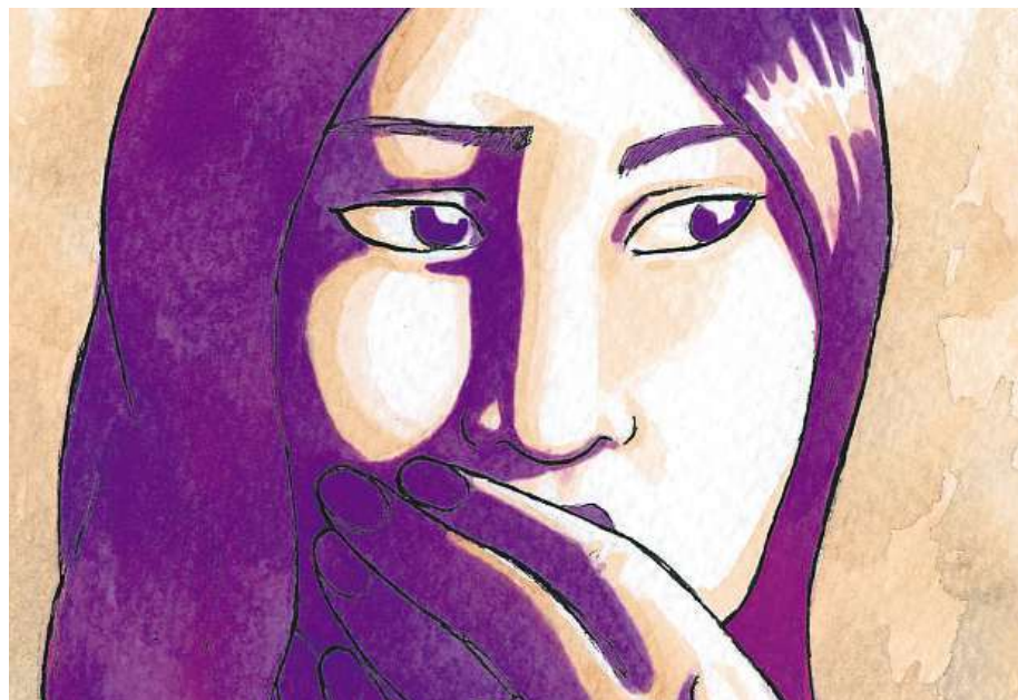
Romeo and Juliet