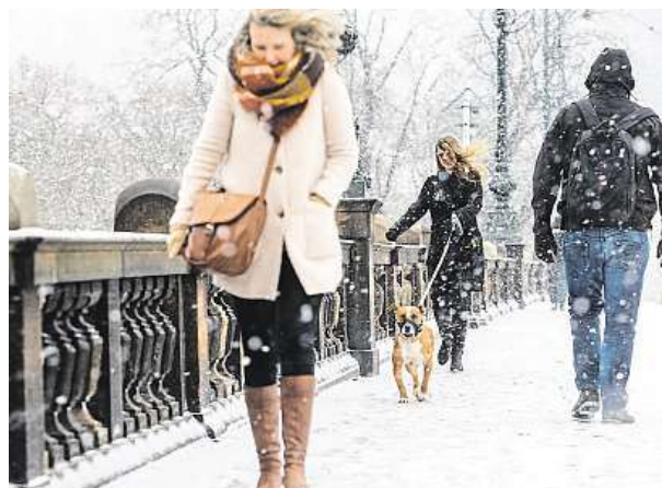
Sníh včera zasypával Prahu.

ne. V pátek v noci teploty spadnou až k minus 15, nejvyšší teploty přes den budou mezi minus 7 až minus třemi stupni. V sobotu by mělo mrázivé počasí vrcholit. To by na některých místech mohl teploměr ukazovat až minus 20 stupňů. Takový mráz bude především ve vyšších polohách. Začátkem příštího týdne se ale teploty dostanou zpět k nule. MAH