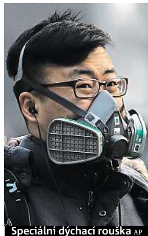
Speciální dýchací rouška

V neděli vyhlásilo pětadvacet čínských měst nejvyšší, červený stupeň znečištění ovzduší. Tento krok znamená zastavení výroby v továrnách, přerušování stavební činnosti a uzavření škol. Koncentrace miniaturních prachových částic ve více severočínských městech v posledních dnech mnohonásobně přesáhla limit maximální hustoty částic PM 2,5 (prachové částice menší než 2,5 mikrometru), který Světová zdravotnická organizace stanovila na 25 mikrogramů na metr krychlový během jednoho dne.