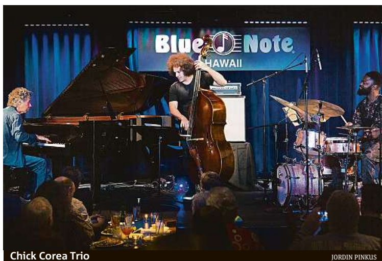
Chick Corea Trio

Jsme Hvězdárna a planetárium Brno a vy jste naše hvězdy!