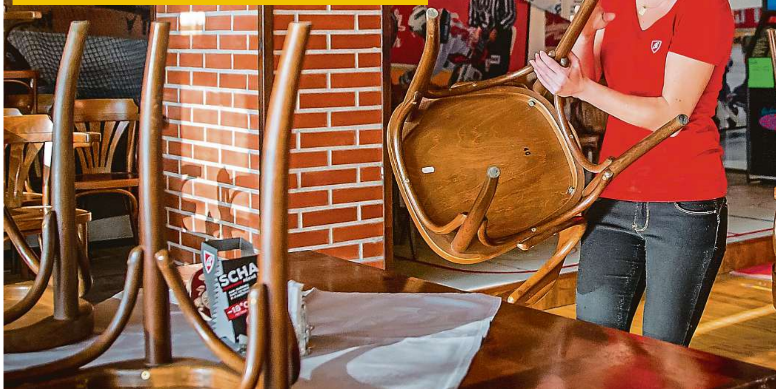
Plno restaurací se připravuje na zítřejší restart. Na snímku je vrchní servírka českobudějovické restaurace Gerbera Michala Šustrová.

UŽ ZÍTRA MŮŽEME JÍT NA PIVO. ŽE JSME NÁROD PIJÁKŮ, JE ALE MÝTUS STRANA 2