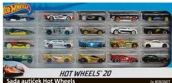
Sada autíček Hot Wheels

Díky transparentnímu balení dárkové sady navíc dopředu přesně víte, která autíčka budete vlastnit. Prostě a jednoduše zábava na čtyřech kolech dvacetkrát jinak.