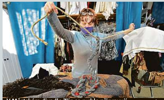
V Městském divadle Zlín se rychle připravují.

Vzrůstá počet cizinců, u kterých byla zaznamenána nákaza infekcí HIV. Letos bylo do konce října zjištěno mezi cizinci ze střední a východní Evropy 88 nových případů, což je dvakrát více než před deseti lety. Mnozí z nich nemají v Česku zdravotní pojištění, a tak je není možné léčit. ČTK