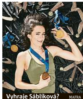
Vyhraje Sáblíková? MAFRA

Přestože sport kvůli letošní pandemii koronaviru přišel o letní olympijské hry a řadu světových i evropských šampionátů, tradice novinářské ankety pokračuje. Favoritkou je Sáblíková, která jako jediná letos získala titul na mistrovství světa v olympijské disciplíně. Triatřicetiletá rychlobruslařka vybojovala na šampionátu zlato na 3000 metrů a stříbro na pětikilometrové trati, navíc už potřinácté ovládla hodnocení Světového poháru na dlouhých tratích.