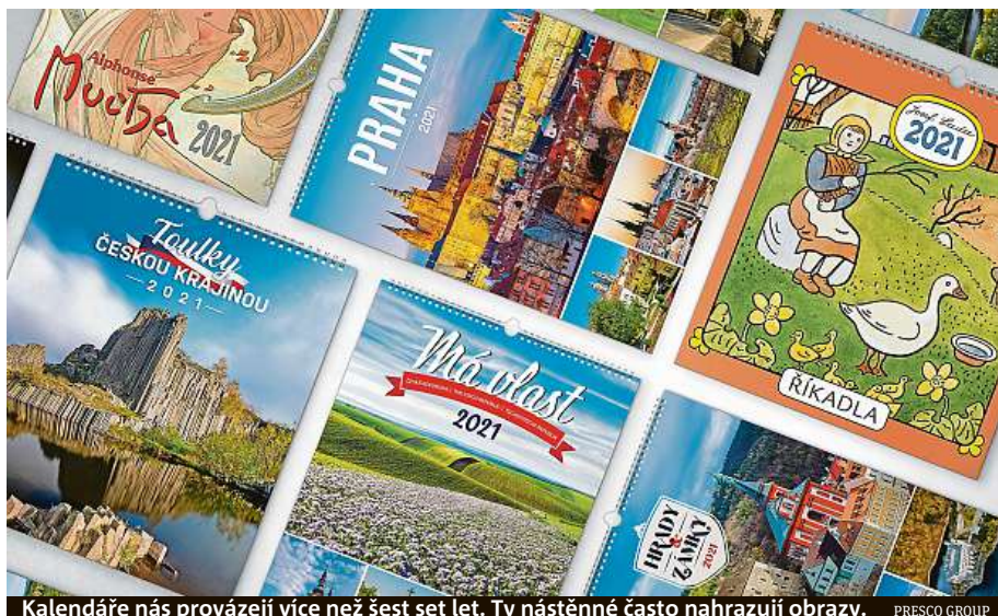
Kalendáře nás provázejí více než šest set let. Ty nástěnné často nahrazují obrazy. PRESKO GROUP

Rozhodně chtějí. Lidé mají potřebu obklopovat se hezkými věcmi, vytvářet si příjemné prostředí. K tomu vedle obrázků nebo fotografií samozřejmě patří i kalendáře. Díky nim si mohou připome-