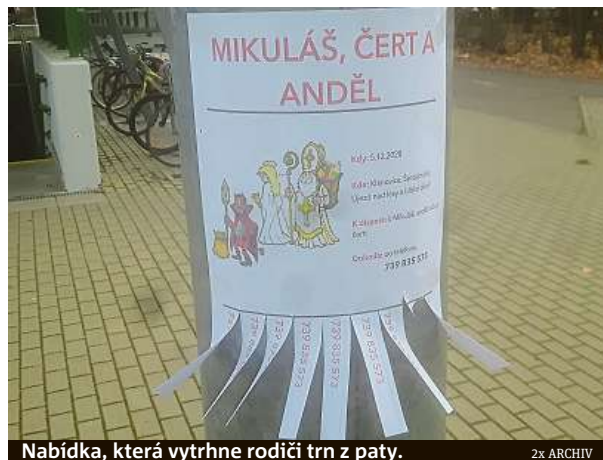
Nabídka, která vytrhne rodiči trn z paty.