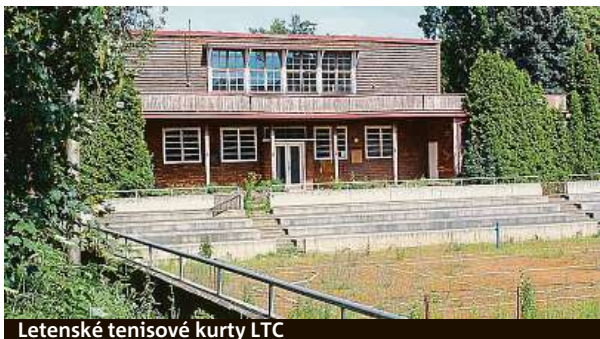
Letenské tenisové kurty LTC

Myšlenka postavit v Praze na strahovském kopci moderní stadion, který by byl hoden historie a velikostí tohoto prostranství, se opět vrací na scénu. Chátrající areál má být podle plánů magistrátu zrekonstruován takřka k nepoznání. „Příští rok by měly být podniknuty první kroky, které revitalizaci sportovního areálu odstartují, aniž by zničily jeho dosavadní ráz