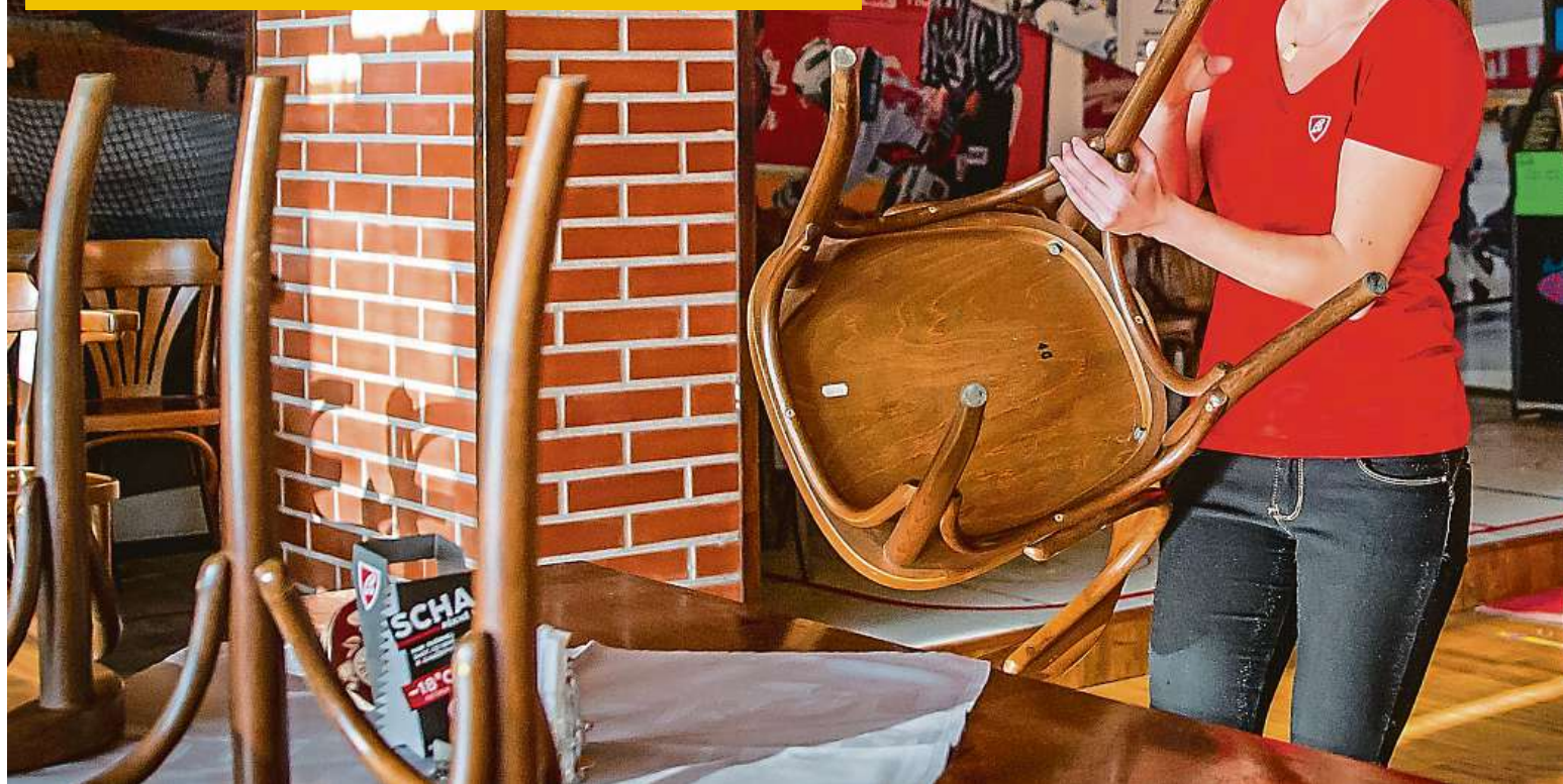
Plno restaurací se připravuje na zítřejší restart. Na snímku je vrchní servírka českobudějovické restaurace Gerbera Michala Šustrová.

UŽ ZÍTRA MŮŽEME JÍT NA PIVO. ŽE JSME NÁROD PIJÁKŮ, JE ALE MÝTUS STRANA 6