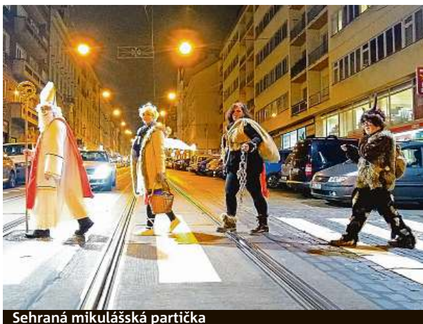
Sehraná mikulášská partička

Hygienické předpisy má v plánu dodržovat také partička, jež nabízí služby Mikuláše, čerta a anděla v Praze 1, 2,