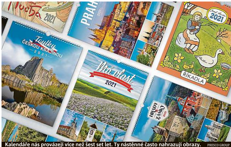
Kalendáře nás provázejí více než šest set let. Ty nástěnné často nahrazují obrazy. PRESKO GROUP

Rozhodně chtějí. Lidé mají potřebu obklopovat se hezkými věcmi, vytvářet si příjemné prostředí. K tomu vedle obrázků nebo fotografií samozřejmě patří i kalendáře. Díky nim si mohou připome-