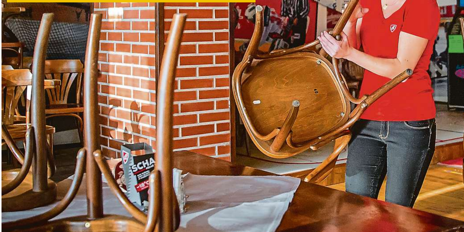
Plno restaurací se připravuje na zítřejší restart. Na snímku je vrchní servírka českobudějovické restaurace Gerbera Michala Šustrová.

UŽ ZÍTRA MŮŽEME JÍT NA PIVO. ŽE JSME NÁROD PIJÁKŮ, JE ALE MÝTUS STRANA 2