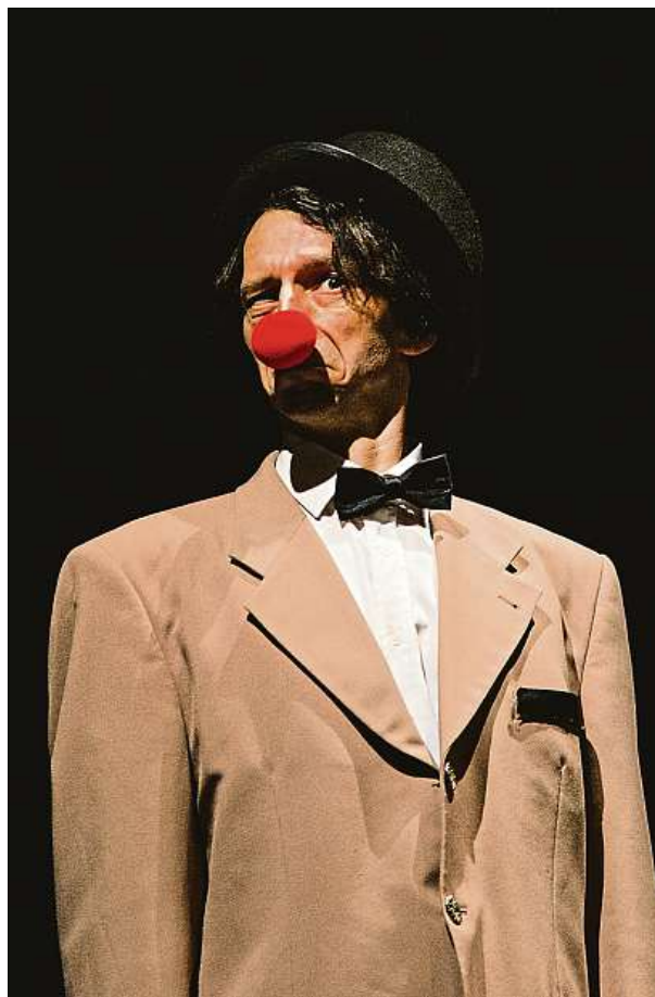
Představení přináší řadu nových skečů.