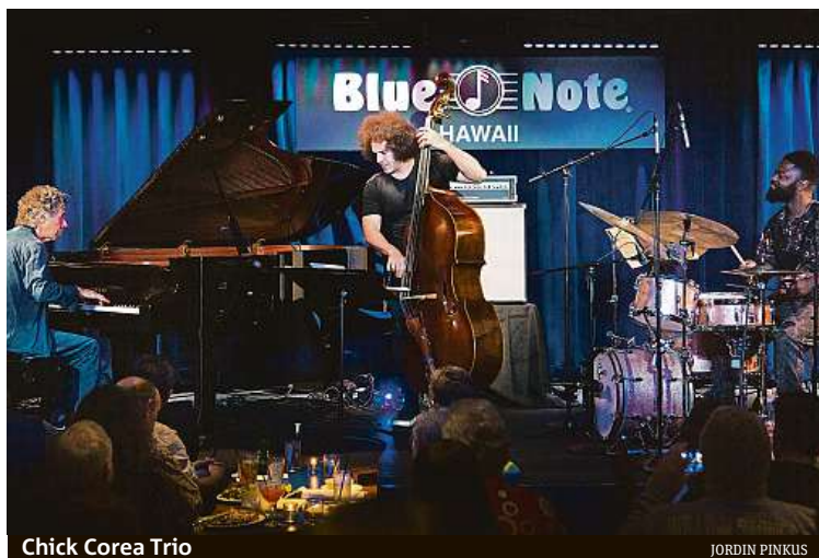
Chick Corea Trio

Jsme Hvězdárna a planetárium Brno a vy jste naše hvězdy!