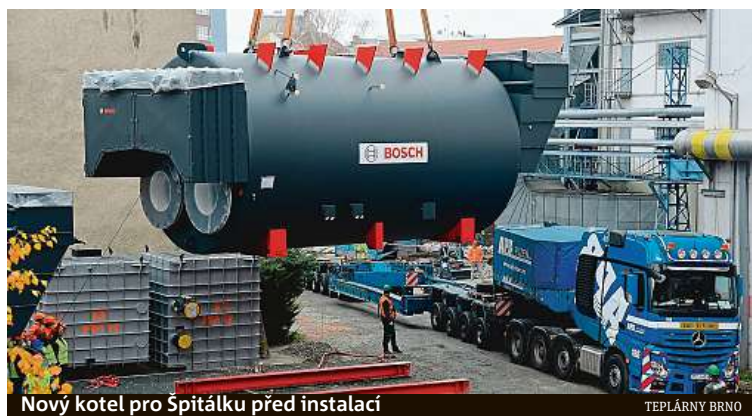
Nový kotel pro Špitálku před instalací