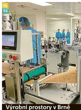
Výrobní prostory v Brně

oprávněně zaštiťoval. V neposlední řadě pověsti firmy v očích veřejnosti jistě nepomohly ani dvě pokuty od České obchodní inspekce v celkové výši přes 200 tisíc korun.