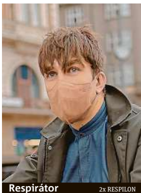
Respirátor 2x RESPILON

Respilon původně začal nabízet nový respirátor již na jaře, ale vzhledem k problémům ve výrobě a omezeným možnostem mezinárodní dopravy musel všechny předobjednávky zrušit a lidem vrátit peníze. Další rozruch vzbudil spor s brněnským VUT, jehož testy se výrobce údajně ne-