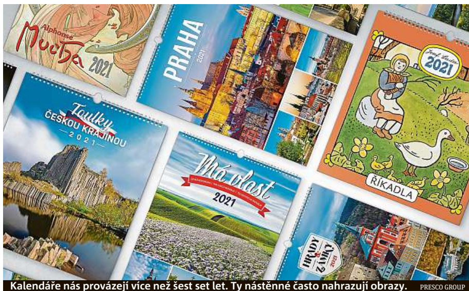
Kalendáře nás provázejí více než šest set let. Ty nástěnné často nahrazují obrazy. PRESKO GROUP

Rozhodně chtějí. Lidé mají potřebu obklopovat se hezkými věcmi, vytvářet si příjemné prostředí. K tomu vedle obrázků nebo fotografií samozřejmě patří i kalendáře. Díky nim si mohou připome-