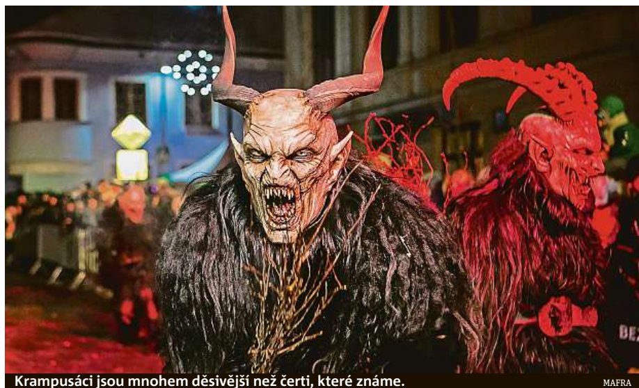
Krampusáci jsou mnohem děsivější než čerti, které známe.