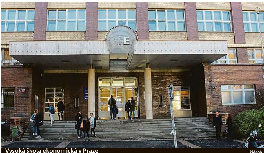
Vysoká škola ekonomická v Praze