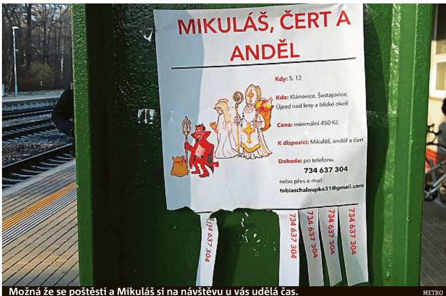
Možná že se poštěstí a Mikuláš si na návštěvu u vás udělá čas.