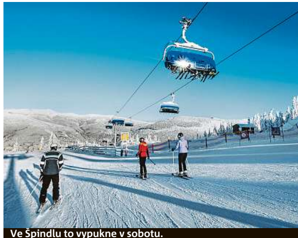
Ve Špindlu to vypukne v sobotu.

V Alpách už se lyžuje, Špindlerův Mlýn zahajuje sezonu o víkendu.