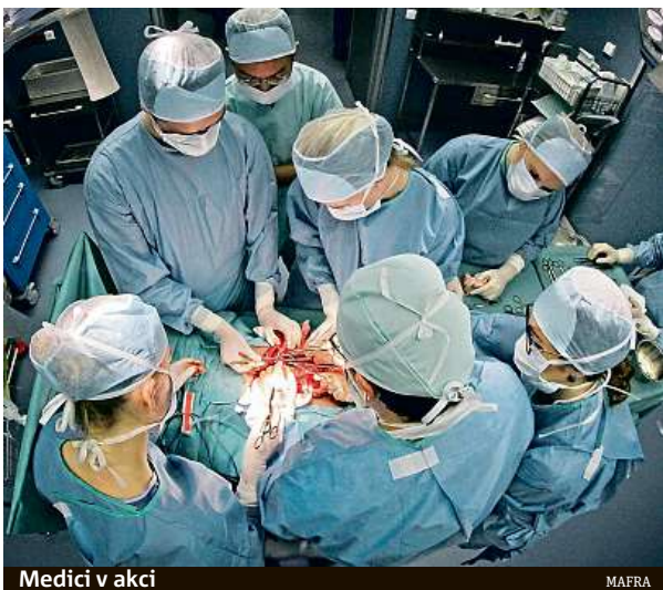
Medici v akci

Budování začalo první etapou v roce 2012. Do roku 2014 na adrese alej Svobody vrostly tři nové objekty – síd-