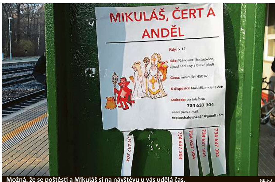
Možná, že se pošestí a Mikuláš si na návštěvu u vás udělá čas.

S dm active beauty kartou a 10násobným body získáte slevu na nákup ještě rychleji. www.dm.cz/sleva