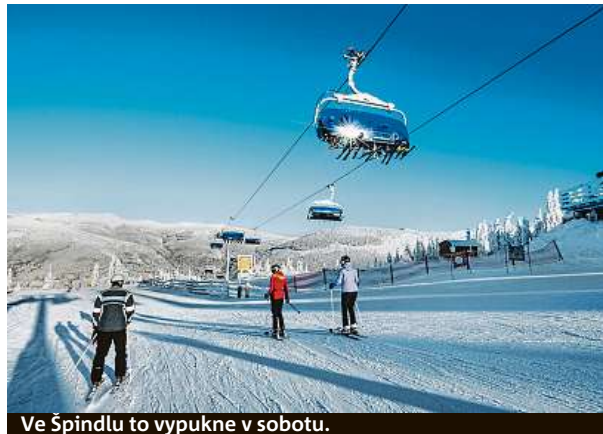
Ve Špindlu to vypukne v sobotu.

V Alpách už se lyžuje, Špindlerův Mlýn zahajuje sezonu o víkendu.