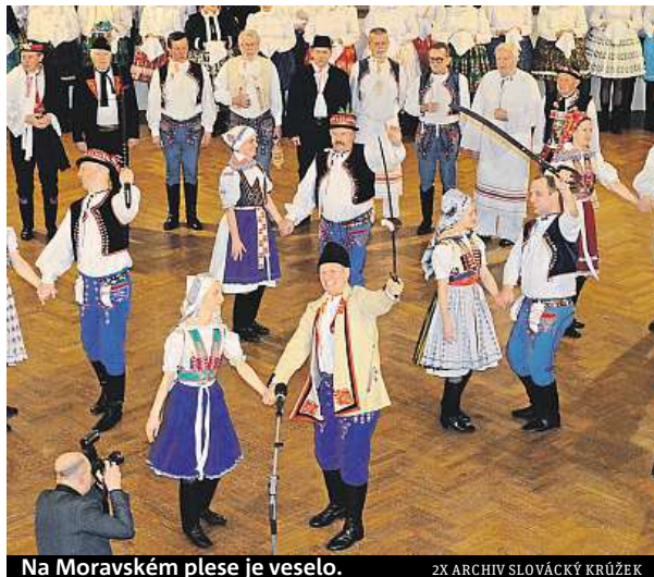
Na Moravském plese je veselo.