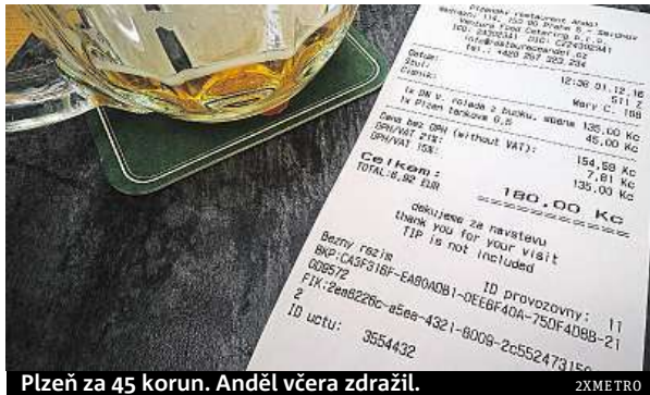
Plzeň za 45 korun. Anděl včera zdražil.

Účtenky se vydávají mimo jiné i proto, aby si zákazník mohl ověřit, zda obchodník danou tržbu řádně zaevidoval. Zkusili jsme to i my. Vyplněné formuláře je zdlouhavě a snadno se při vyplňování kódů, které mají přes 30 zna-