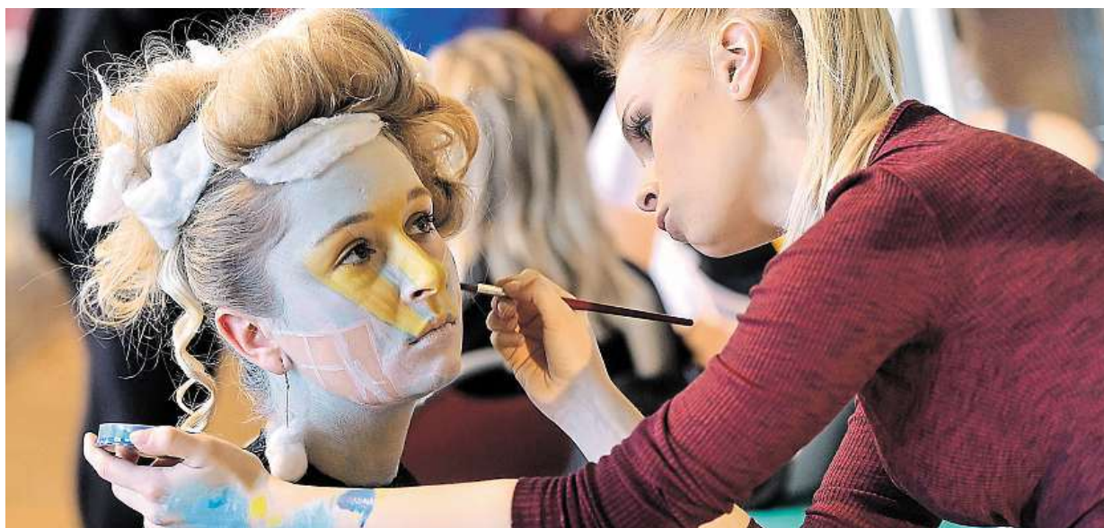
Studenti středních škol se v Jihlavě zúčastnili soutěže pro mladé módní tvůrce. Více fotek na straně 3

Revoluce. Restaurace od včerejška posílají účtenky Finanční správě. Zdražily. Část si kvůli evidenci tržeb i přes nižší sazbu DPH účtuje víc, některé skončily. Takhle ne. Řada podniků včera na protest zavřela STRANA 4