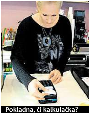
Pokladna, či kalkulačka?

S EET se musejí od včera popasovat i restaurace. Řada z nich ale včera neotevřela. Některé z technických důvodů – pokladna jim nefungovala. Jiné na protest. „Dnes po dobu obědu – zavřeno. Stop EET!“ viselo na dveřích smíchovské restaurace Tradice. O kus dál v restauraci Hrom do police fungovali normálně. Tedy skoro. „Nestíháme, podniky kolem mají zavřeno, a tak šli všichni k nám. Máme trojnásob hostů,“ říká číšník. Lidé tu na jídlo čekali o dost déle než běžně a to pokladna jela bez problému. Tak jako ve většině podniků po Česku. „U žádného z našich více než tisíce zákazníků nemáme hlášení, že by systém úplně spadl. Nicméně i přesto jsme za-