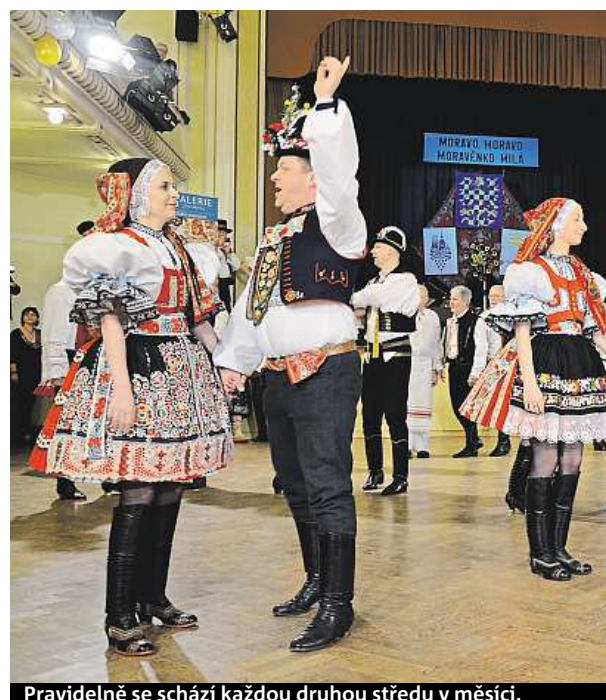
Pravidelně se schází každou druhou středu v měsíci.

Na prosincové besedě, kdy děti hrají a předvádějí vánoční hry. Akce se bude konat od 19 hodin 14. prosince v pražském divadle Gong ve Vysočanech.