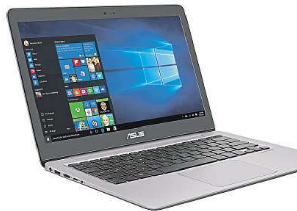
Ultrabook ASUS je skvělým tipem na dárek.

Při nákupu ZenBooku UX310UA-FC058T v e-shopu Mironet teď navíc získáte externí DVD vypalovačku a praktický obal v celkové hodnotě 1599 korun.