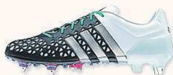
adidas ACE 15.1