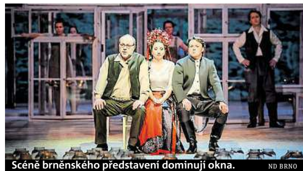
Scéně brněnského představení dominují okna. ND BRNO