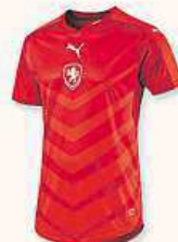
PUMA ČESKÝ REPREZENTAČNÍ DRES