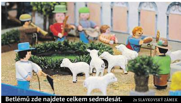
Betlémů zde najdete celkem sedmdesát. 2x SLAVKOVSKÝ ZÁMEK