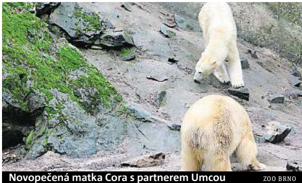
Novopečená matka Cora s partnerem Umcou ZOO BRNO

Cora byla s medvíďetem uzavřena v porodním boxu, kde ji chovatelé pozorují prostřednictvím kamer. Z boxu