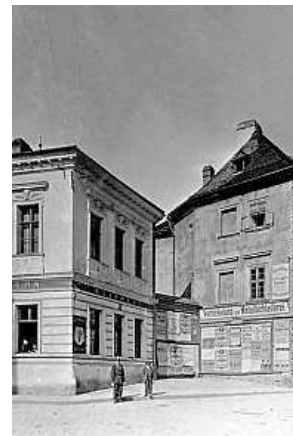
Pivovar v Brně ARCHIV

Poupě prošel několika českými pivovary, kde ale jeho pokrokovost narážela často na nevěli pivovarské chasy a někdy i vrchnosti. Svůj talent naplno projevila až v Brně, kde řídil městský pivovar. Na jeho zdech na Šilingrově náměstí sládky připomíná pamětní deska. V sobotu budou výstavními sály provázet návštěvníky kuráto-