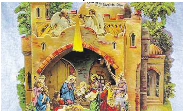
Výstava ve slavkovském zámku potrvá do 13. prosince.