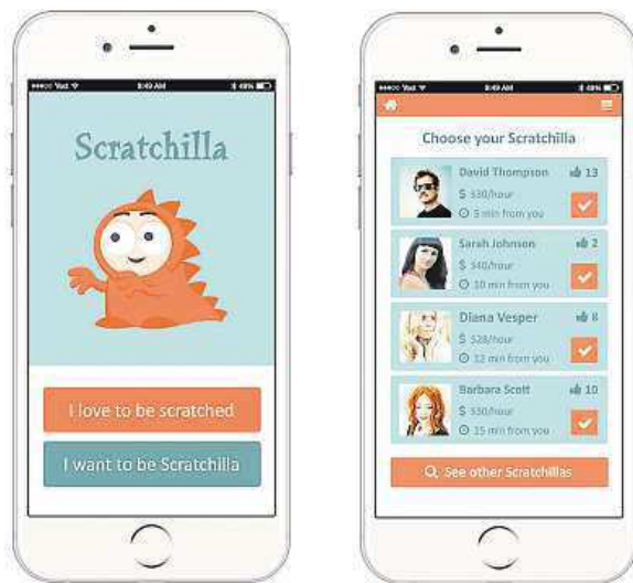
Chcete poškrabat vy sami, nebo někoho jiného?

A fungovat by měla zhruba takto: člověk sedí v kanceláři, je unavený, dal by si šlofika. Potřebuje zkrátka vzpruhu. Zapne aplikaci a uvidí, že v okruhu tří kilometrů je ve „škrabacím on-módu“ třeba pět lidí, kteří jsou ochotni přijít a za určitou cenu ho poškrabat. Předem si může naklikat, o jak dlouhou radost stojí, dozví se cenu a pošle žádost. Dotyčná scratchilla, jak škrabajícím lidem vyvojáři říkají, odpoví, zda může přijít, či ne. A klient přes aplikaci také zaplatí. „Už se nám ozvala i řada masérů, které to zau-