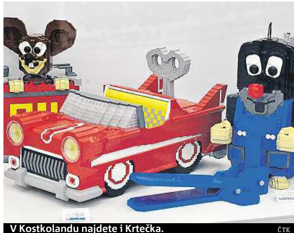
V Kostkolandu najdete i Krtečka.