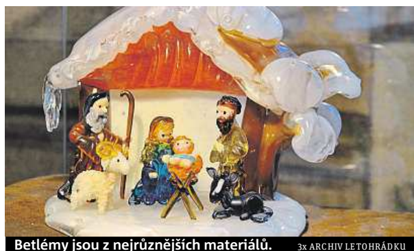
Betlémy jsou z nejrůznějších materiálů.