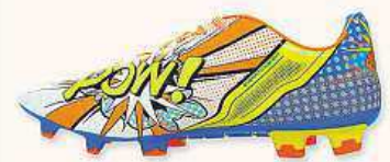
PUMA EVOPOWER 1.2 POP ART

Sleva 25% na produkty Nike, adidas a Puma v obchodě Top4Football.