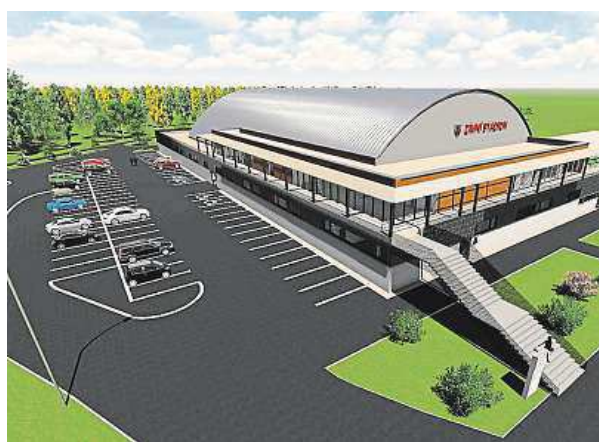
Takto by měl nový zimní stadion ve Vyškově vypadat.