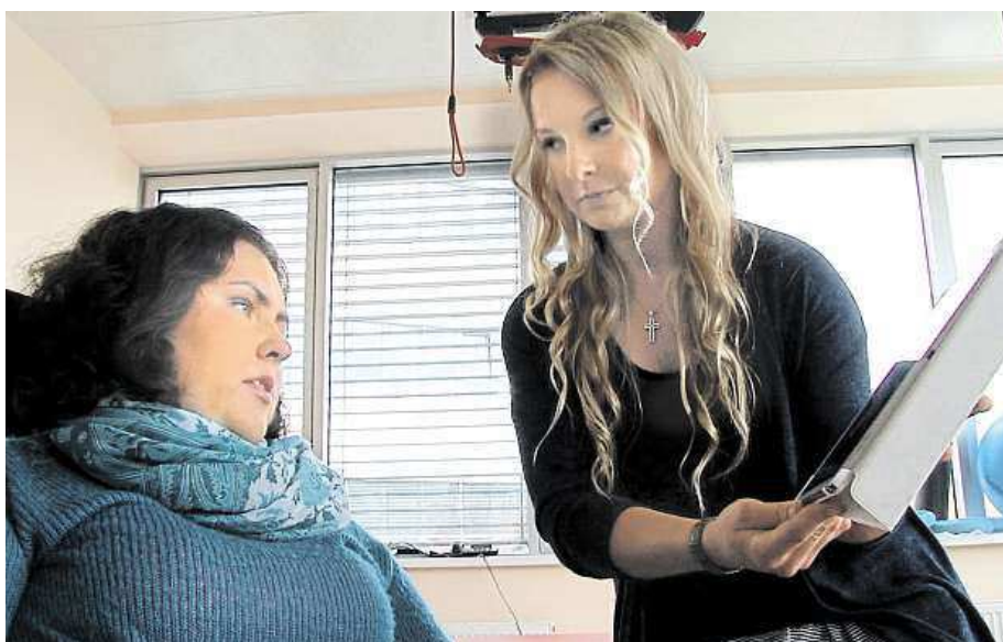
Klientům byt pomůže třeba v situacích, kdy potřebují realizovat bezbariérovou úpravu svého vlastního.

„Vracíte se někam, kde nemůžete dělat vůbec nic,“ vzpomíná. A právě v těchto těž-