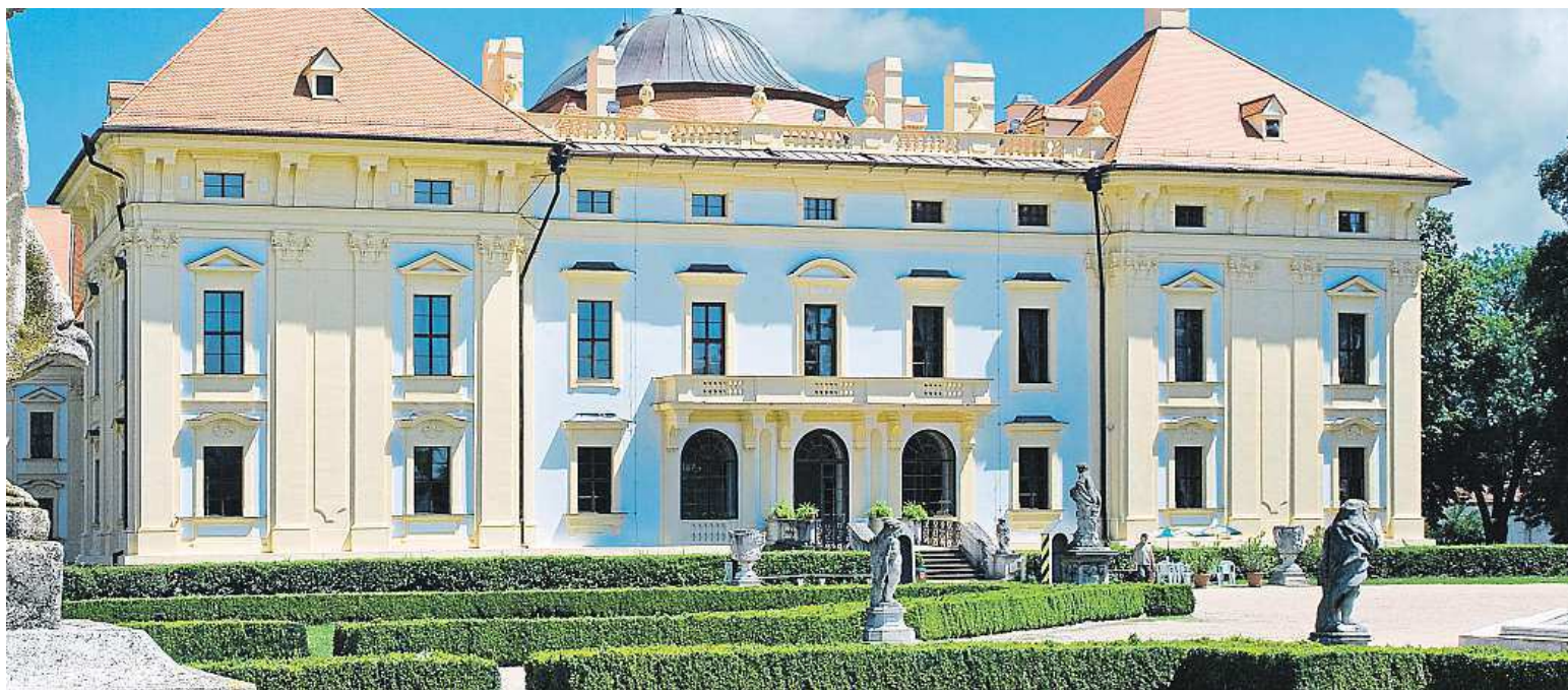
Barokní sochy jsou nedílnou součástí zámeckého parku ve Slavkově.