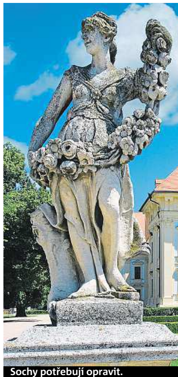
Sochy potřebují opravit.

Přesto by mohly administrativní průtahy sochám dost ublížit. Sochařská výzdoba parku je totiž ohrožena, už několik let je zapsaná v seznamu neohroženějších památek. Jak rychle se však podaří vlastnictví vyřešit, není jisté. V současné době město čeká na verdikt vyškovského soudu, kde byla podána takzvaná určovací žaloba. BARBORA SLEZÁČKOVÁ