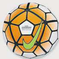
NIKE MÍČ ORDEM 3