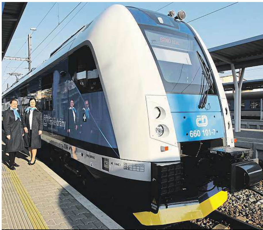
Spěšné vlaky a rychlíky linky R5 využijí moderní jednotky InterPanter.

Lidem z okolních měst, kteří se do Brna vydávají za kulturou či jinou zábavou, však chybí vlaky kolem půlnoci. Poslední vlaky jedou totiž kolem jedenácté večer a další až kolem čtvrté ráno.