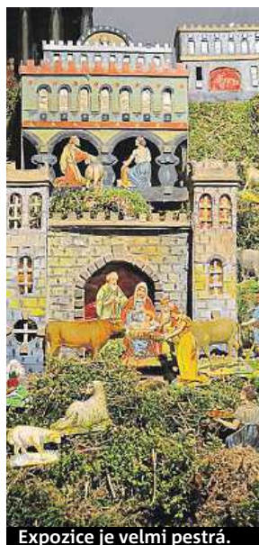
Expozice je velmi pestrá.

Výstavu doplní vánoční květinové dekorace, pryskyřičí vonící stromčky a historické