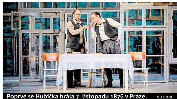
Poprvé se Hubička hrála 7. listopadu 1876 v Praze. ND BRNO