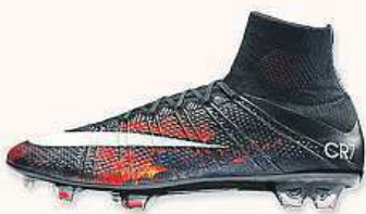
NIKE MERCURIAL SUPERFLY CR7