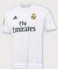
adidas DOMÁCÍ DRES REAL MADRID