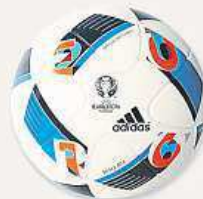
adidas MÍČ EURO 16