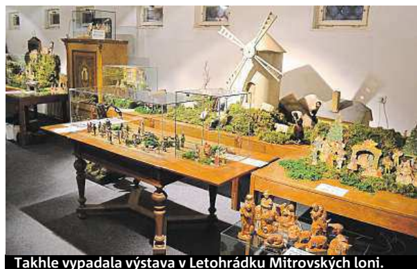
Takhle vypadala výstava v Letohrádku Mitrovských loni.

ké vánoční ozdoby z období od 30. do 90. let minulého století. Výstava je otevřena od úterý do neděle, vždy od 10 do 16 hodin a potrvá až do 10. ledna 2016. RADEK BABIČKA