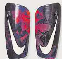
NIKE CHRÁNIČE CR7 MERCURIAL LITE