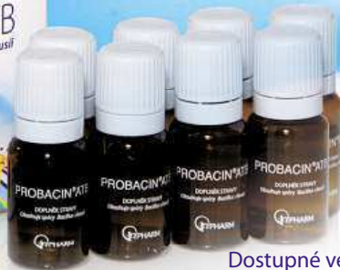
Dostupné ve všech lékárnách a na www.samoleceni.cz

vysoká odolnost vůči širokému spektru antibiotik pro děti od 6 měsíců a dospělé