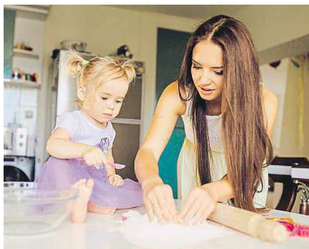
Delší rodičovská může v budoucnu uškodit.

Každý rok pobytu doma s dítětem sníží příjem ženy o 1,1 procenta. Rozdíl mezi výděly žen a mužů zvyšuje i počet dětí.