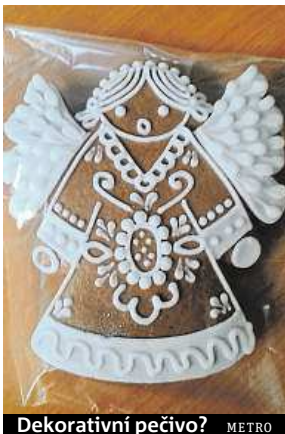
Dekorativní pečivo? METRO

„Víte, pro výrobce jsou tu tvrdé předpisy, tak si takhle