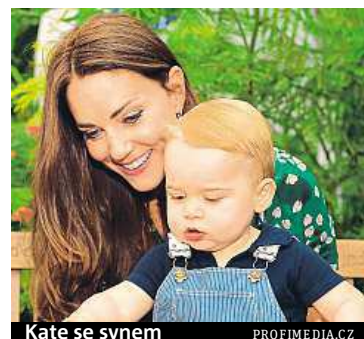
Kate se synem

Po narození britského prince George se toto jméno propadlo v žebříčku popularity.