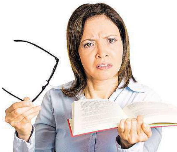
Ti, co nosí brýle, mohou příznaky přehlédnout.

Co to vlastně VPMD je? Jedná se o oční onemocnění, které postihuje centrální část sí-