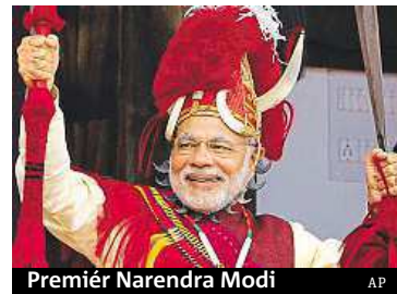
Premiér Narendra Modi