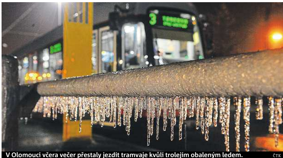
V Olomouci včera večer přestaly jezdit tramvaje kvůli trolejím obaleným ledem.

Například včera totálně zkolabovala v Brně hromadná doprava, na některých místech troleje vlivem námrazy v jihomoravské metropoli zkratovaly. „Tramvajové a trolejbusové linky jsou z většiny doslova paralyzová-