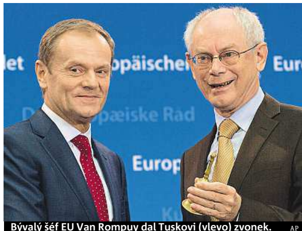
Bývalý šéf EU Van Rompuy dal Tuskovi (vlevo) zvonek.

Polský představitel, u kterého je zdůrazňováno jeho evropanství a schopnosti prokázané v domácí politice, byl pro některé překvapivou volbou. Jasnou podporu měl ale například od německé kancléřky Angely Merkelové, se