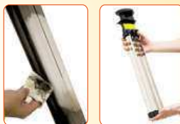
Filtry není třeba nikdy vyměňovat! Stačí je jen občas jednoduše vyjmout a otřít. Účinek filtrace ihned vidíte!

Až 70 % Čechů dýchá škodlivý vzduch! Od roku 2006 zemřelo kvůli znečištěnému ovzduší bezmála 34 tisíc Čechů a další tisíce lidí se musely léčit v nemocnicích. Vysoké koncentrace polévatého prachu, chemikálií a jiných nečistot vážně ohrožují naše zdraví. Hygienici v těchto dnech bijí na poplach a doporučují nevětrat. Je ale prostředí v uzavřené místnosti skutečně zdravější než to venkovní?