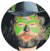
Pavel Físpa Zvu kamarády. Děti poznají, že Mikuláš má dědovy pantofle.