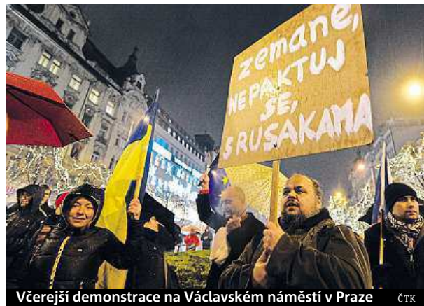
Včerejší demonstrace na Václavském náměstí v Praze ČTK

tovými kroky proti demokratickému zřízení a svrchovanosti v kontextu Ústavy“. Organizátoři akce nazvané Sto tisíc podpisů z Václaváku na Hrad předali petici na Pražském hradě. K elektronické petici se připojilo téměř 100 tisíc lidí a denně přibývají stovky dalších. Přímou na arších jich mají čtyři tisíce. Aby se požadavky Senát zabýval, chybí ještě šest tisíc. ČTK, MAP