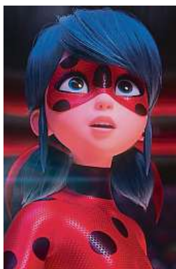
Kouzelná Beruška brání Paříž před zlem. BONTONFILM