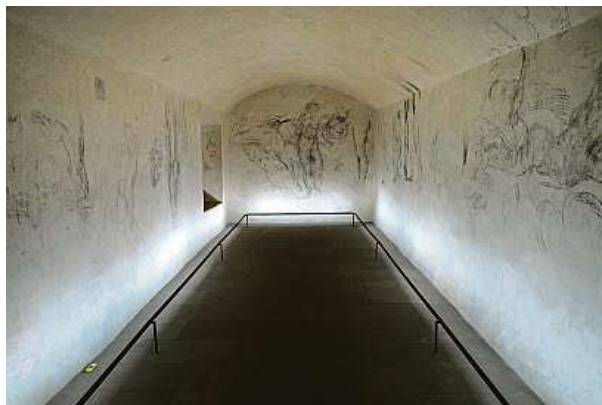
Michelangelo Buonarroti Je také autorem freskové výzdoby Sixtinské kaple ve Vatikánu a slavné mramorové sochy Davida.

Malé skupinky o čtyřech lidech si budou moci místnost