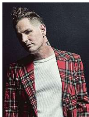
Frontman Slipknot Corey Taylor v sólovém projektu RFP

Příští léto od 12. do 15. června proběhne 28. ročník festivalu Rock for People v hradeckém Parku 360. Fanoušci se mohou těšit na nespoutanou rockerku Avril Lavigne, frontmana kapely Slipknot Coreyho Taylora v sólovém