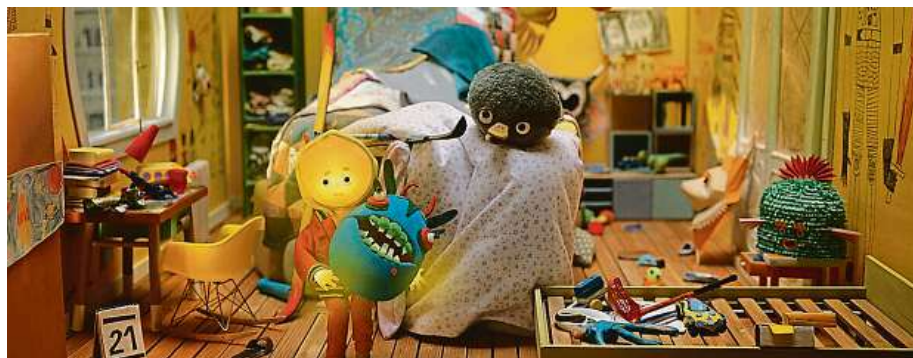
Vystoupit ze svého soukromého fantazijního světa do toho skutečného není pro děti jednoduché. Velký svět ve filmu Tonda, Slávka a kouzelné světlo reprezentuje obrovský činžák.

příběhem o přátelství a fantazii, o světle a o tmě.