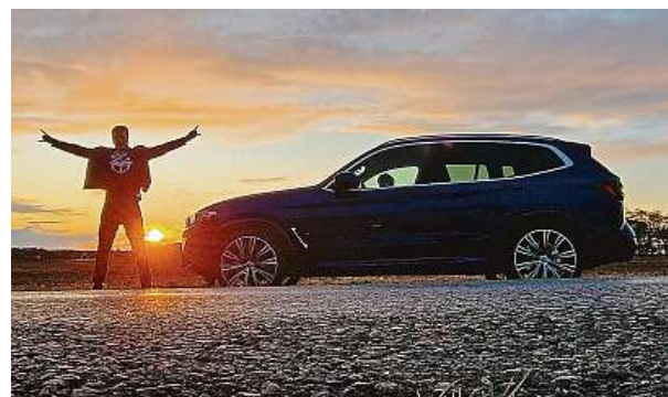
X3 je docela velký model, laik ho mnohdy nerozezná od větší X5. Autor textu má pro srovnání výšku 192 centimetrů.