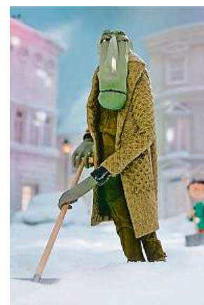
Česká animace je v posledních letech opět na světové úrovni.