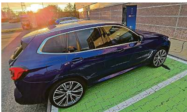
Maximální nabíjecí výkon AC je 3,7 kW. Tady nabijeme u nákupáku ve Zličíně, během zhlédnutí filmu jsme se dostali na plnou kapacitu.