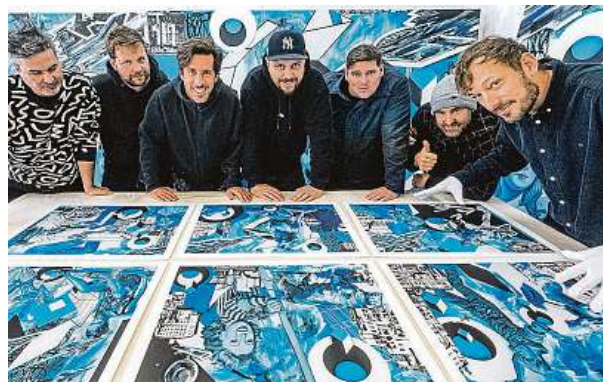
Výstava svým názvem odkazuje na pravděpodobně nejznámější poštovní známku v historii filatelie.

Expozice začala minulý týden, v pražské výstavní síni Mánes potrvá až do příštího čtvrtka. „Návštěvníci se můžou těšit na výstavu sedmi výrazných osobností současné umělecké scény pod jednou střešou, na společné dílo obřích rozměrů a další