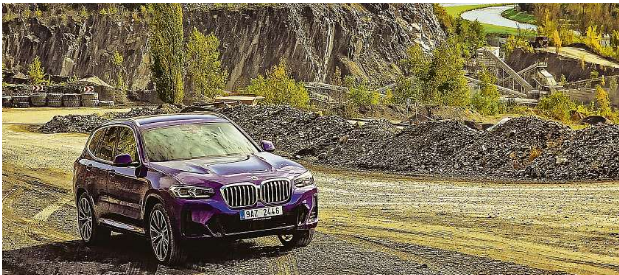
V lomu působí jako pěst na oko. Zajímavá modrofialová barva na přímém slunečním světle vynikne v nečekaném odstínu. Líbí se vám?