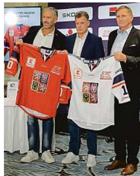
Nové dresy české hokejové reprezentace

„Nominace je určená zdravotním stavem a výkonností hráčů, pak také vytížeností v klubech. To vše jsme zvažovali a bylo to důležité pro nominaci,“ uvedl Rulík na tiskové konferenci v Praze, kde bylo zároveň oznámeno, že realizační tým rozšíří jako jeho asistent Tomáš Plekanec, který minulý týden