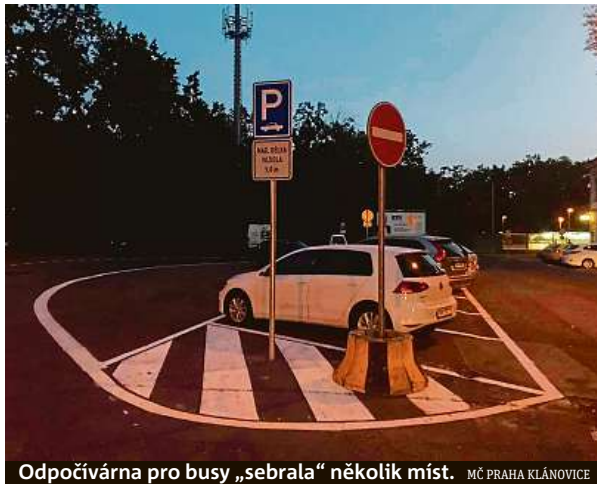
Odpočívárna pro busy „sebrala“ několik míst. MČ PRAHA KLÁNOVICE

Novopečenou odstavňovou plochu pro autobusy někteří řidiči buďto nevědomky přehlíželi, či přímo odmítli respektovat. Podle tajemníka úřadu městské části Petra Vilguse tu poté v následujících týdnech strážníci denně rozdávali až patnáct pokut. „Bezohlední řidiči dokonce zcela zablokovali provoz veřejné dopravy na nádraží Praha-Klánovice sever. Linky 221 a 303