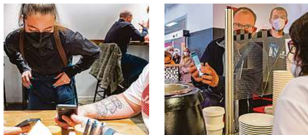
Kontroly hostů, zda mají doklady o bezinfekčnosti.

Přísné kontroly a vlna kritiky. ČR má dál „své“ popírače nebezpečí.