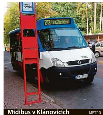
Midibus v Klánovicích