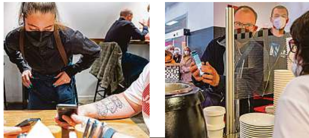
Kontroly hostů, zda mají doklady o bezinfekčnosti.

Přísné kontroly a vlna kritiky. ČR má dál „své“ popírače nebezpečí.