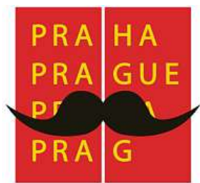
Magistrát se zapojí. MHMP

Listopad je opět ve znamení projektu Movember. Ten šíří osvětu týkající se zdraví mužů.