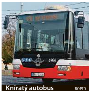
Kníratý autobus. ROPID

Polepením masek svých dopravních prostředků černými kníry se pražský dopravní podnik letos opět zapojuje do celosvětové kampaně Movember. Ta podporuje zdraví mužů a prevenci rakoviny varlat či prostaty.