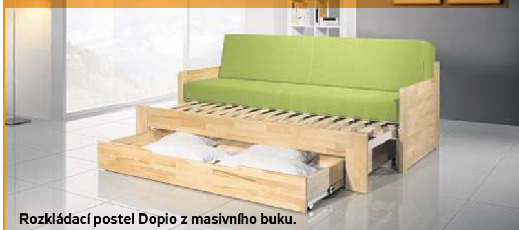
Rozkládací postel Dopio z masivního buku.

Rozkládací postele vyřeší spaní a sezení „v jednom“ tam, kde je málo prostoru. V malém bytě vyřeší problém, kdy skloubení sezení a spaní do jednoho je z prostorových důvodů nutností. Rozkládací postele mohou nabídnout i spaní pro hosty, jsou vhodným řešením také do dětských pokojů nebo na chatu či chalupu. Kvalitní rozkládací postel tedy může sloužit jak pro každodenní spaní, tak i pro spaní příležitostně.