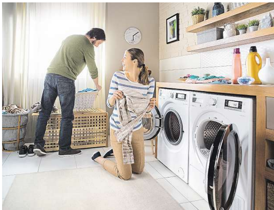
Více informací o produktech najdete na www.chcisusicku.cz .

Konkrétně, pro vysušení osmi kil bavlenného prádla spotřebuje sušička 1,29 kWh. Převáděno na peníze je to zhruba 4,8 koruny (při průměrné ceně 3,71 koruny/kWh). Vysušení čtyř kil oděvů ze syntetiky bude stát 1,9 koruny. Těto rekordně nízké spotřeby dosahuje pomocí inovovaného tepelného čerpadla EcoGentle™, které vyniká nejen nízkou spotřebou elektrické energie, ale i nízkou teplotou sušení. Díky ní je sušení šetrné vůči textiliím, do-