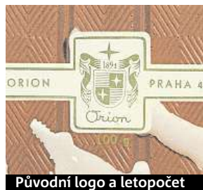
Původní logo a letopočet