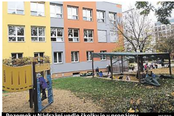
Pozemek v Nádražní vedle školky je v pronájmu. METRO

Směna dvora u školky Prahy 5 za pozemek v Prokopáku se radnici vyplatila.