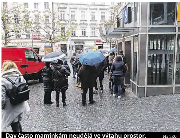
Dav často maminkám neudělá ve výtahu prostor. METRO

„Co tu lidé musejí pro vstup do metra ujit pár kroků navíc, je to bída. Spousta se jich totiž místo pár minut chůze navíc raději natlačí do výtahů. Pak se stává, že se nechtějí ani rozjet, protože jsou přetížené. Tlačící se dav taky často zapomíná pustit jako