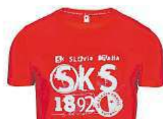
Aktuální triko PROSLAVISTY.CZ

kolo... ocitneme se v roce 1892. V Praze. Ve Vodičkově ulici. Na podzim.“ Tehdy sportovci vytvořili svůj odbor Liteární a řečnické Slavie, říkalo se mu Akademický cyklistický odbor Slavia. Fotbal se pod hlavičkou klubu začal hrát až v roce 1896. Přesto se dlouhá desetiletí považoval za rok vzniku SK Slavia rok 1893. Dříve vyšla před 24 lety kniha Slavia stoletá.