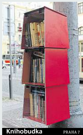
Knihobudka PRAHA 7