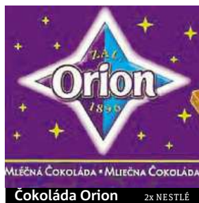
Čokoláda Orion 2x NESTLÉ