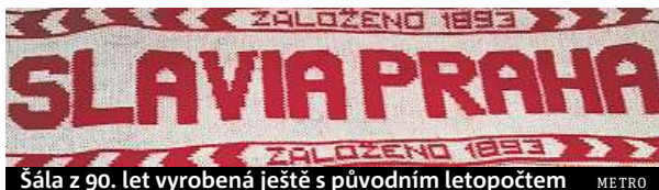
Šála z 90. let vyrobená ještě s původním letopočtem METRO

Sportovní klub Slavia dnes slaví 125 let, ale mohlo to být i o rok méně.