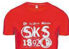
Aktuální triko PROSLAVISTY.CZ