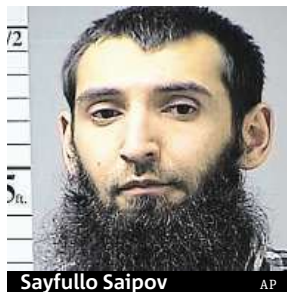
Sayfullo Saipov

Pro skupinu deseti Argentinců byl výlet do New Yorku vrcholem oslav jejich 30. výročí od absolutoria na polytechnickém institutu v argentinském městě Rosario. V úterý ale jejich pobyt v metropoli východního pobřeží Spojených států tragicky skončil, když do nich dodávkou najel přistěhovalec z Uzbekistánu Sayfullo Saipov (v přepisu z uzbecktiny Sajfulláh Saipov). Při útoku, který americké úřady považují za teroristický,