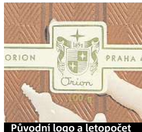
Původní logo a letopočet