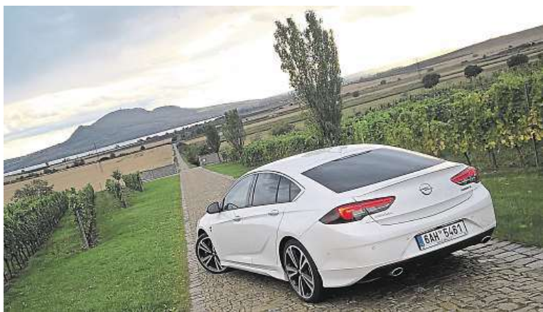
Pro toulky vinařskou oblastí Pálava jako stvořená.