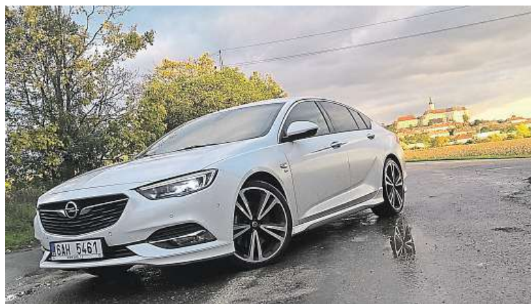
Opel se vrací mezi elitu. Co se designu týče, tak určitě. Povedené auto!