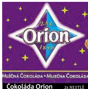
Čokoláda Orion 2x NESTLÉ