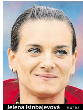
Jelena Isinbajevová

Zmínění sportovci doplatili na vyloučení celého ruského svazu z mezinárodních atletických soutěží. Sami přitom nikdy pozitivní test neměli.