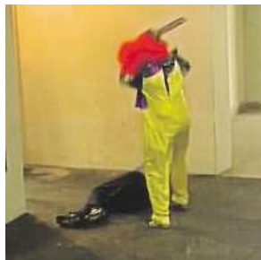
Klaun řádl v Hulíně. Policie ho hledá.