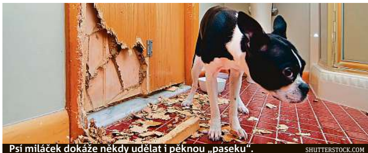
Psi miláček dokáže někdy udělat i pěknou „paseku“.

Je ovšem třeba zmínit spoluúčast. Některé pojišťovny u pojištění odpovědnosti občana spoluúčast nevyžadují žádnou, některé jen tisíc korun, jiné mohou chtít i 30 procent, je třeba se proto dobře seznámit s podmínkami. MET