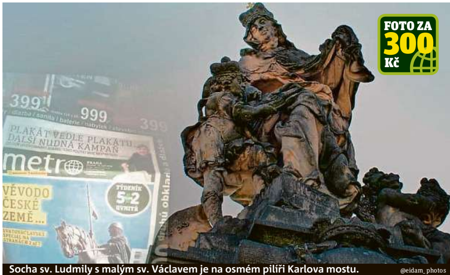
Socha sv. Ludmily s malým sv. Václavem je na osmém piliři Karlova mostu.