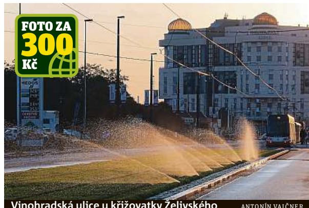
Vinohradská ulice u křižovatky Želivského

O nové travnaté pásy ve Vinohradské ulici se stará zavlažovací systém.