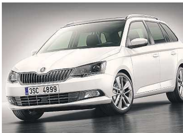
Před kombíku je totožná s hatchbackem.

Nabídka motorů se neliší od hatchbacku s jedinou výjimkou. Majitelé kombi se nebudou muset trápit s nejslabším provedením 1.0 MPI/44 kW. Základní pohonnou jednotkou nové Škody Fabia Combi se stane výkonnější varianta benzinového tříválce s litrovým objemem, která ze sebe vydoluje až 55 kW. Zájemci o svižnější svezení sárnou po čtyřválcových turbomotorech 1.2 TSI. Ten silnější umí až 81 kW. Spořivci bu-