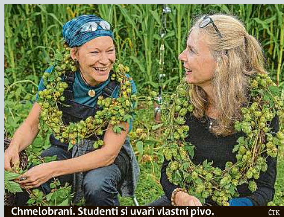
Chmelobraní. Studenti si uvaří vlastní pivo. ČTK

Ve finále ceny Architekt roku 2021 jsou čtyři tvůrci či studia. Odborná porota vybrala architektky, kteří se v období uplynulých pěti let svým přístupem významně zasloužili o architekturu v České republice. Slavnostní vyhlášení výsledků bude 21. září na veletrhu FOR Arch v pražských Letňanech. Ve finále jsou Kuba & Pilař architekti, Petr Janda, David Kraus a Petr Stolín. ČTK