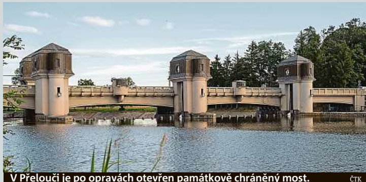
V Přelouči je po opravách otevřen památkově chráněný most.