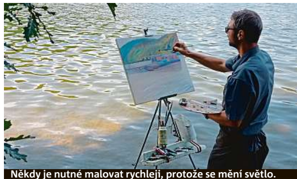
Někdy je nutné malovat rychleji, protože se mění světlo.