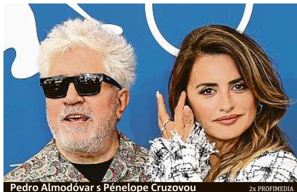
Pedro Almodóvar s Pénelope Cruzovou

Benátský festival je nejstarší filmovou přehlídkou na světě. Podle odborníků se v posledním desetiletí kvalita festivalu velmi zvýšila a filmy uvedené či oceněné v Benátkách bodovaly i v dalších mezinárodních soutěžích. ČTK