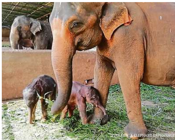
PINNAWALA ELEPHANT ORPHANAGE

Pětadvacetiletá slonice Surangi ze sloního sirotčince v Pinnavale na Srí Lance v úterý porodila dvojčata. Otcem samečků je sedmnáctiletý Pandu, který žije rovněž v sirotčinci. Ředitelka zařízení Renuka Bandaranaikeová řekla, že obě mláďata jsou sice malá, ale zdravá. Podle odhadů žije na Srí Lance divoce 7500 slonů. Jejich odchyt je trestný a pachatel za něj může dostat trest smrti.