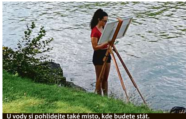
U vody si pohlíďte také místo, kde budete stát.