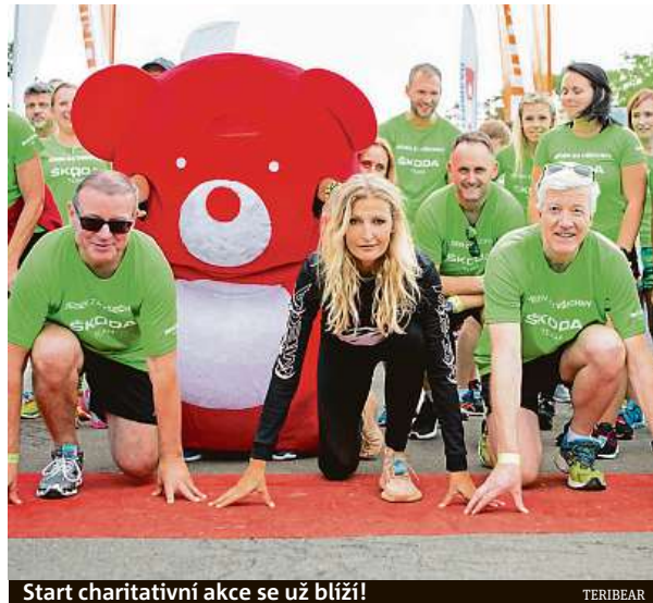
Start charitativní akce se už blíží!

Protože se tento rok bude představovat projekt nové cílové skupině, rozhodla se agentura při vymyšlení strategie vrátit ke kořenům akce. „Prvotní myšlenkou je pomáhat pohybem – když jdeš na procházku, do obchodu nebo jedeš na kole. Může to znít trochu naivně, jako by to byla dětská fantazie – jednoduchá, upřímná. Pro dospělě-