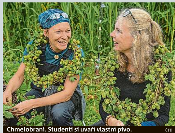
Chmelobraní. Studenti si uvaří vlastní pivo.